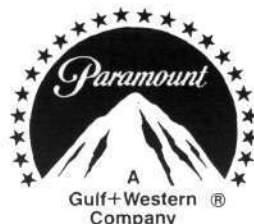
Slika 2: Paramount, s soncem osvetljen snežni vrh

Če hočemo dognati, v kolikšni meri je sodobni človek še zavezan mitičnim povezavam s kozmosom, se ne moremo opreti na njegovo (znanstveno) refleksijo o samem sebi. Ravnanje novodobnega človeka moramo analizirati