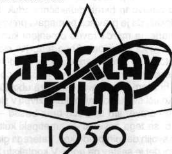
Slika 3: Triglav v logotipu filmskega podjetja Triglav film

Če si podrobneje ogledamo ta model gospodarjenja, pa ugotovimo, da ne gre samo za gospodarske koristi.