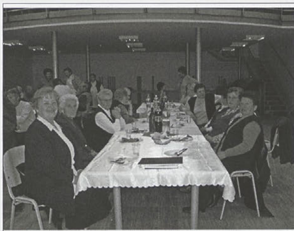
Zbrani kulturniki na delovnem srečanju

OFS šteje 40 plesalcev od 6. do 9. razreda OŠ iz Zavrča. Plešejo v glavnem štajerske plesne in pejejo domače pesmi. V letu 2007 so nastopili ob paznikih in dogodkih v občini Zavrč, pa tudi na državni