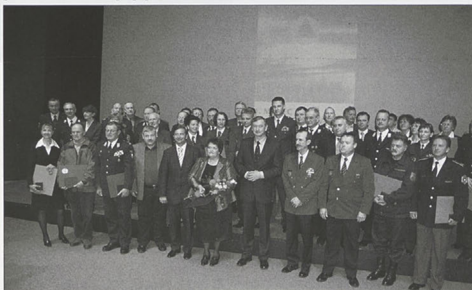
V družbi dobitnikov odlikovanj CZ