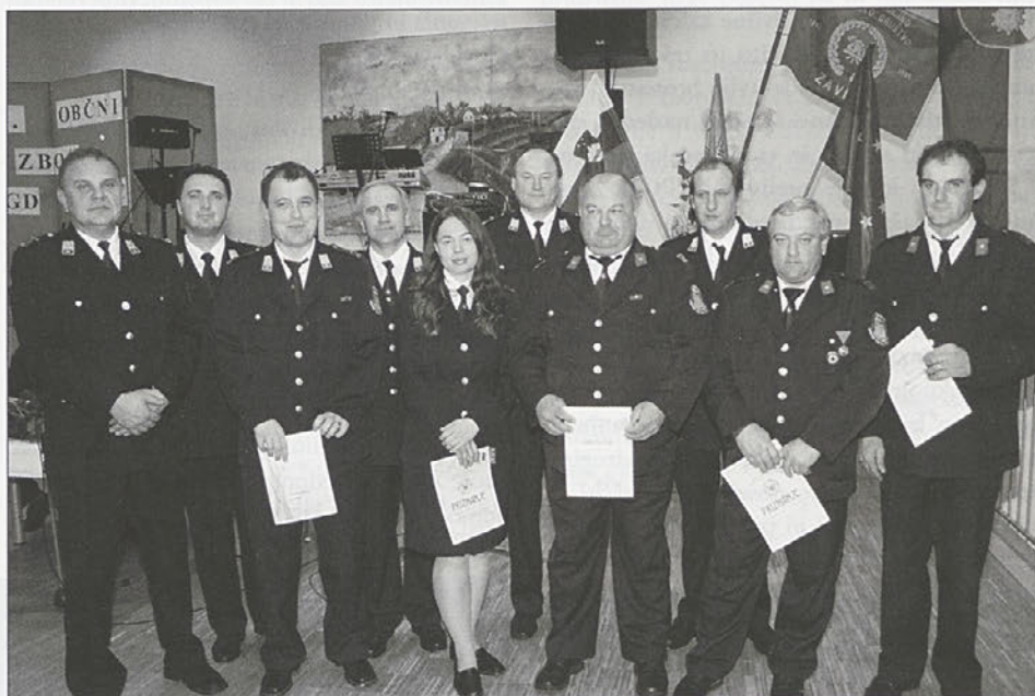
Dobitniki gasilskih priznanj, zahval ...