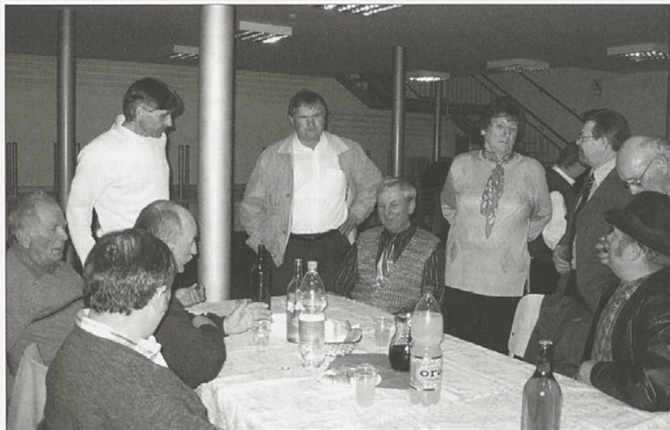
Zapeli so domači pevci in tako popestrili druženje doma

reviji Pika poka v Rogaški Slatini v maju. Za folklorna oblačila skrbijo starši plesalcev. Mentorica se žal ni udeležila občnega zbora.