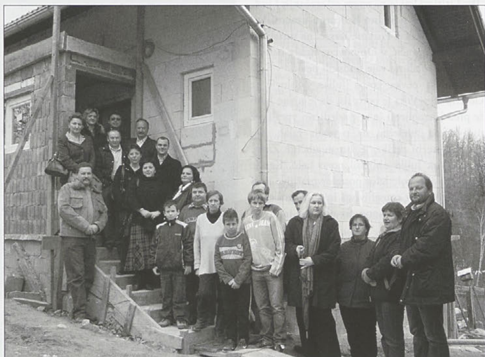
Z družino so se nove pridobitve veselili mnogi donatorji in zaslužni za dobro opravljeno delo.