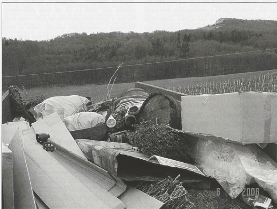
Nič kaj lepa fotografija iz neposredne bližine završkega pokopališča