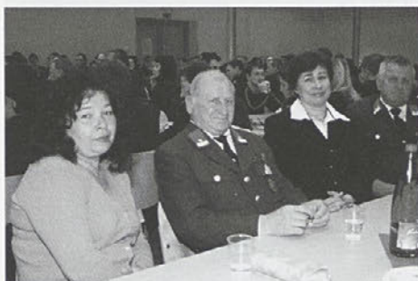
Avstrijski kolegi se vedno radi vrnejo v Zavrč, tudi s svojimi partnerji.