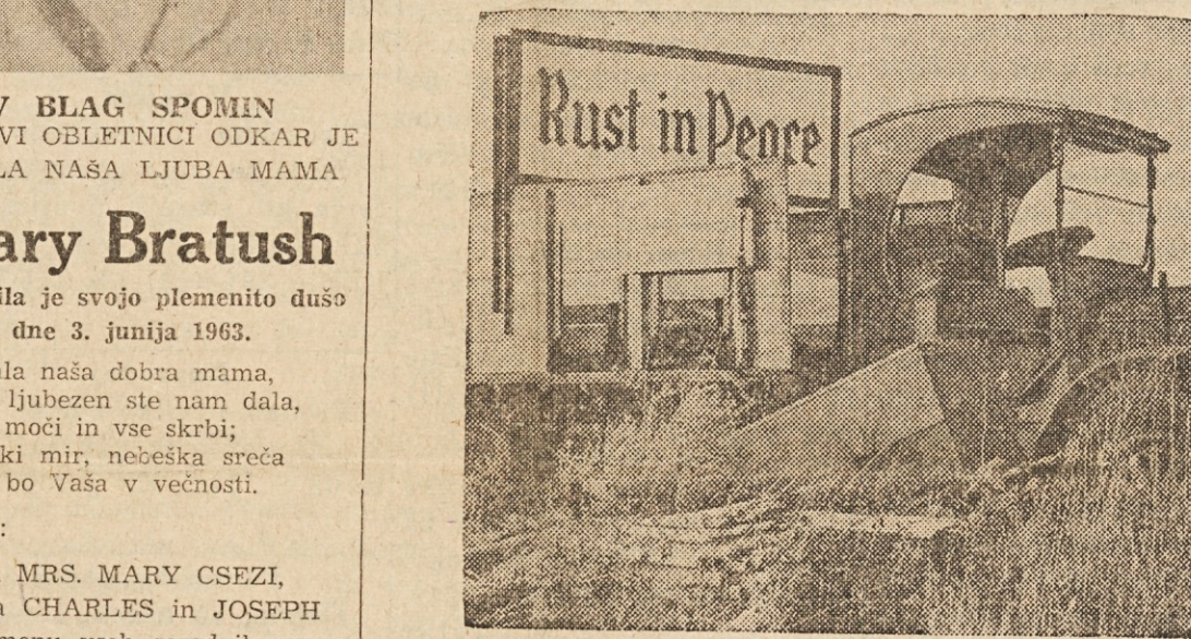
V MIRU RJAVI! — Prekupčevalec s starim železom je postavil nad prostorom, kjer ima svoje "blago", napis "Rust in Peace", po naše "V miru rjavi!"

tastes like other beers wish they could!