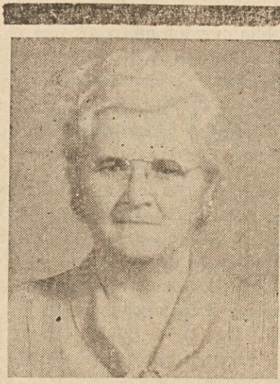
V BLAG SPOMIN OB PRVI OBLETNICI ODKAR JE UMRLA NAŠA LJUBA MAMA

Zemljepisno delijo teh šest kavkaških narečij v dve skupini: na severu je lesgiška in čerkeska, na jugu pa georgijska, suanska, lacijska in mingrelska. Če sem izmed teh šestih narečij izbral prav mingrelščino, sem to storil samo zaradi besede. Vsakdo mi mora namreč priznati, da ima ta beseda nekako prepričljivo moč, poleg tega sem pa na zemljevidu še ugotovil, da je današnja Mingrelija nekdanja staroveška Kolhida. Jaz pa sem bil vendar romantik in klasicist! Toda vse to bi bilo samo prazno navduševanje, če ne bi v knjižnici dobil knjige o mingrelskem jeziku. Lju-