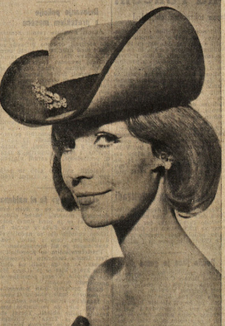
Neki francoski modni ustvarjalec si je omislil gornji model klobučka, ki je prav gotovo zanimiv, toda le redki bo zares pristajal