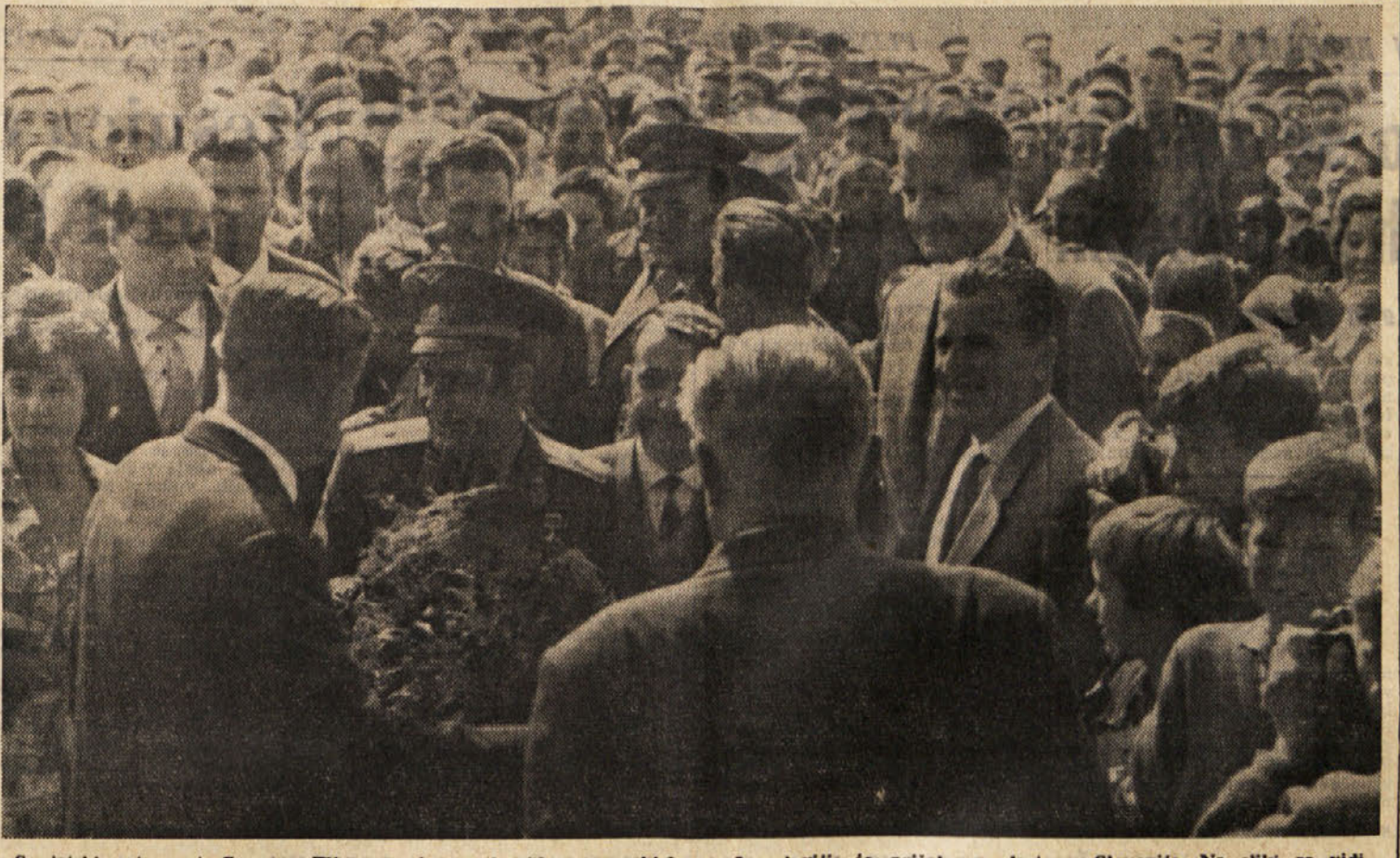
Sovjetski astronaut German Titov, ki je na desetdnevnem obisku v Jugoslaviji, je prišel v soboto v Slovenijo. Na sliki ga vidimo med predstavniki oblasti in množico, ki ga je pričakala na ljubljanskem letališču.