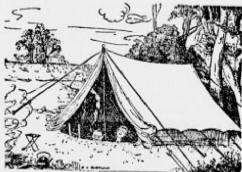
Navada je navada! Ljudje, ki imajo v mestu kletno stanovanje, so si čez nedeljo postavili šotor na izletu.

»Da, grof ima en milijon Samo tega ne vem, ali premoženja ali dolgov.«