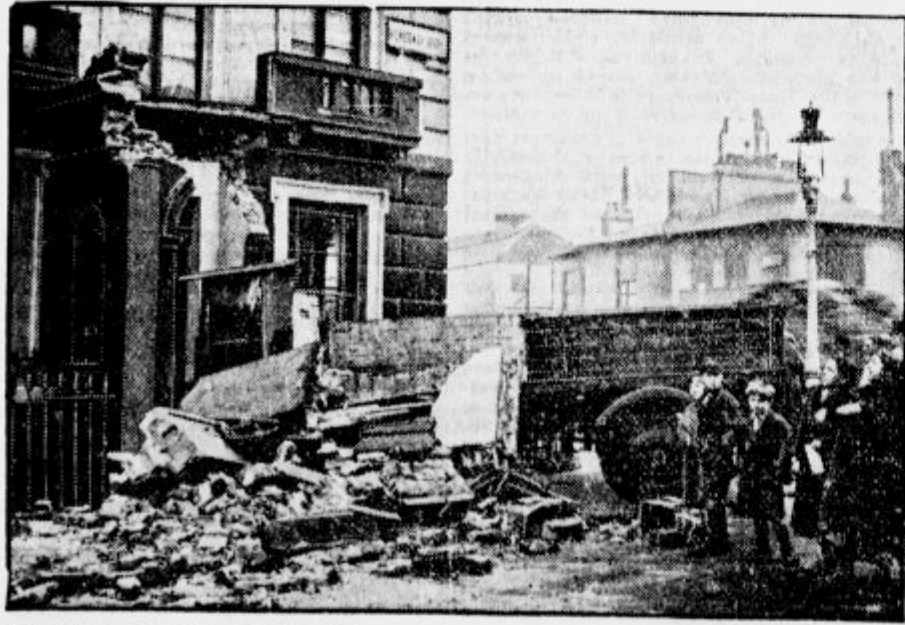
V Londonu se je priklopni avtomobil odpel od motornega avtomobila ter zdrčal po strmini navzdol in se s tako silo zaletel v neko hišo, da je ves prednji del podrl.

Druga stran podobe pa je četam skrbno prikrita. Italijanski vojaki ne vidijo niti enega ranjenca, katere skrivaj in ponoči prevažajo na bolniške ladje. Ta prevoz na skrivaj je zelo dobro organiziran. Poročila o boleznih med italijanskimi vojaki na bojišču si zelo nasprotujejo. Domačini pripovedujejo, da umrje po 15 belih vojakov na dan. Uradno pa to odločno zanikajo in trde, da v šestih mesecih ni umrlo