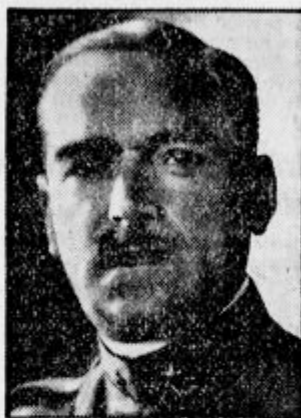
V Turinu je umrl italijanski maršal Gaetano Giardino.

topniški poročnik. Udeležil se je nesrečne italijanske vojne l. 1896. v Abesiniji ter se vojeval tudi l. 1911. in 1912. s Turki v Libiji. L. 1916. je bil predčasno imenovan za generalnega majorja. S tem mu je bilo izrečeno odlikovanje, ker je s svojimi četami zavzel Sabotin nad Gorico. Ob koncu vojne je bil vrhovni poveljnik italijanskih čet. Meseca novembra l. 1919. je postal šef italijanskega generalnega štaba. Ko so prišli na oblast fašisti, je Badoglio postal italijanski poslanik v Braziliji, od koder se je vrnil l. 1926. ter prevzel vodstvo generalnega štaba italijanske vojske. L. 1929. je bil poslan za generalnega guvernerja v Libijo, kjer si je pridobil velikih zaslug, ko je to kolonijo takorekoč vnovič zavzel in jo pomiril. 25. julija leta 1929. je postal italijanski maršal. Ko se je l. 1933. vnovič vrnil v domovino, je kot šef generalnega štaba prevzel velik del odgovornosti za pripravljenost italijanske armade.