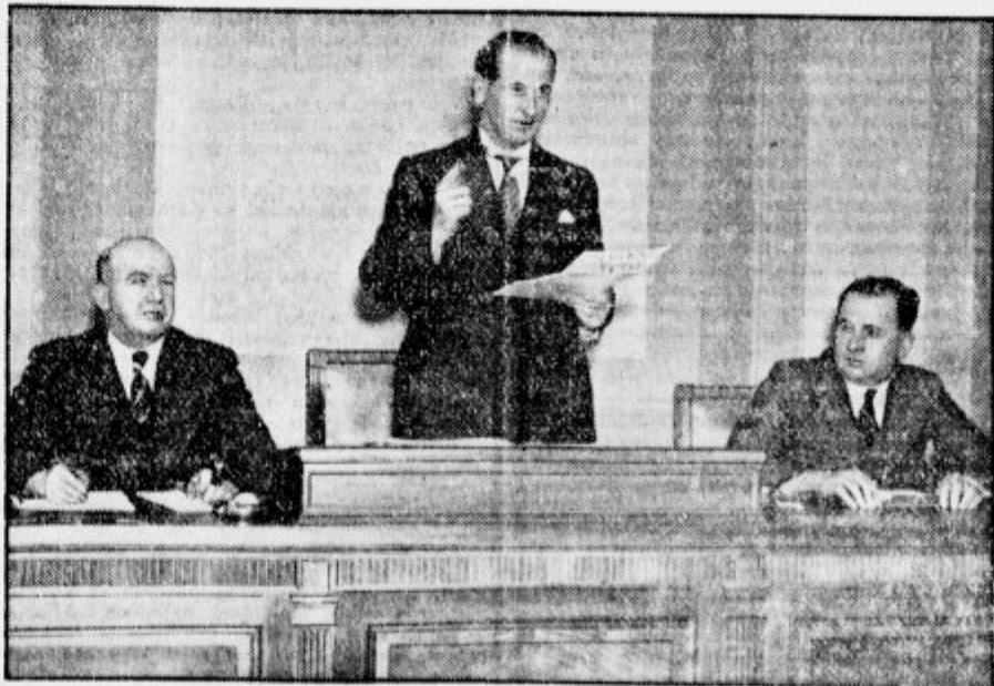
Angleški premogarji so s 93% glasov glasovali za generalno stavko. Na sliki vidimo predsednika zveze premogarjev, ki razglša izid glasovanja.

Sele čez mnogo let se je izkazalo, kako koristna je bila ta naprava. Danes ta brzojavna progna igra veliko vlogo v trgovini in vsem življenju črne Afrike.