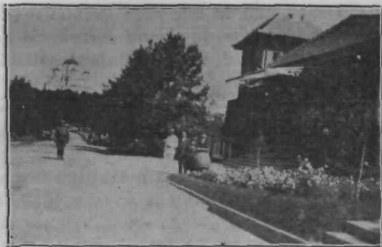
Kraljev dvorec na Oplencu (v ozadju cerkev sv. Đorđa).

Tako hoče današnji naš miroljubni vladar, da bodi Topola s svojo okolico žarišče miru in zadovoljstva, od koder naj izhaja delo za gospodarski razvoj države k njenemu blagostanju, kakor je svoj čas bila ta okolica žarišče, od koder je izhajalo delo za osvoboditev Jugoslavije.