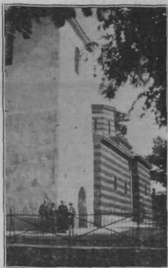
Karađorđeva kula in stara cerkev v Topoli.

Tako bo cerkev veličasten spomenik srbske slave za osvoboditev jugoslovenskega rodu in najprimernejši kraj, da počivajo v njem smrtni ostanki voditeljev tega slavnega pokreta.