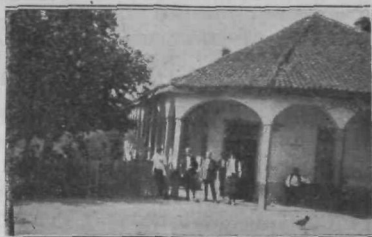
Mehana (gostilna) v Topoli, v katero je zahajal Kara Đorđe.