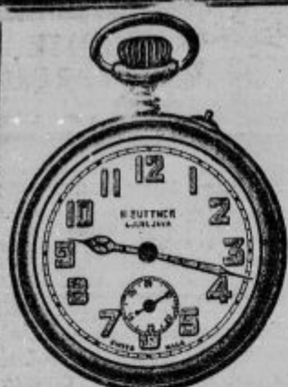
St. 122. Kovinska anker-Roskopf, s sekundnim kazal. cem. dobro kolesje, radi-um svetilka oče se -tev lke in kazalot samo D 94-- St. 122-1. Ista brez sekund. kazalca D1 93--