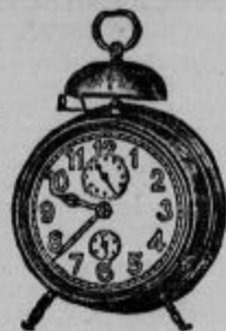
St. 123. Budilka 16 cm vis., dobro kolesje, 3 letno jamstvo . . . . . Din 49-- St. 125. Enaka 19 cm visoka . . . . . Din 64-20 St. 126. Enaka z 10 ali 15 ov. a kazalci . . . . . Din 75-- St. 129. Kovi. Srepla ura z dobrih koles. m 3 letno jamstvo . . . . . Din 44-- St. 131. Enaka z radij. svetilkami in kazalci D'm 58--

PR JATELJI Zakaj so francoske linije najkrajše v Severno in Južno Ameriko . — Zato, ker je francosko pristanišče Le Havre najbližje New-Yorku in Ljubljani ker velikanski parniki »Ile de France«, »Paris« itd. vozijo samo 5 dni čez morje, ker je na parnikih izborna postrežba, okusna domača hrana in »Bor.« vino brezplačno. — Najkrajša pot v Južno Ameriko pa gre preko pristanišča Marseille 14 do 15 dni v Argentino .