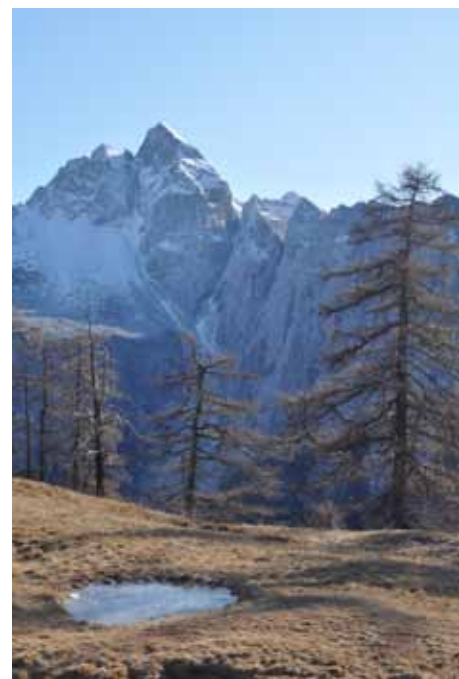
V Prilogo I Direktive o habitatih so vključeni tudi visokogorski habitatni tipi, kot so skalne razpoke v apnencu in alpska travišča.

Z zadnjo spremembo uredbe o Naturi 2000 je Slovenija torej dokončala formalizacijo območij Natura 2000, ki jih je predlagala leta 2004 ob vstopu v EU. Delo pa še ni zaključeno. Seveda sta spremljanje stanja in doseganje varstvenih ciljev posameznega območja najpomembnejša stalna naloga. Bolj zaskrbljujoče je dejstvo, da se je na biogeografskih seminarjih izkazalo, da Slovenija glede opredelitve območij dosega le 73 % določenih ciljev, kar pomeni, da bo morala obstoječe omrežje še vsebinsko dopolniti, nekatera območja razširiti, nekaj pa jih celo na novo opredeliti. Ni se nam treba bati, da bi za Naturo 3000 zmanjkalo dela! ✨