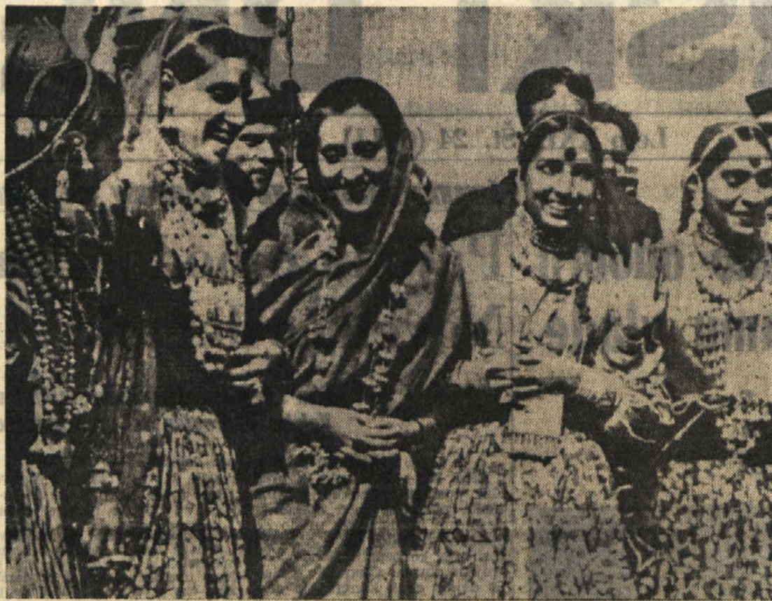
Indira Gandhi, ki je bila pred kratkim izvoljena za naslednico pokojnega šastrija na mesto ministrke za predsednika, je na sliki v skupini deklet s Himalaje, ki so prispele z delegacijo svoje dežele počastiti novo predsednico

SAO PAULO, 28. — Brazilsko zdravstvene oblasti so sporočile, da je zaradi izrednega vročinskega vala v Sao Paulu ta mesec umrlo 109 otrok.