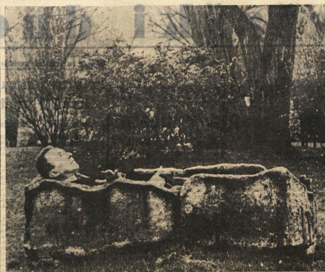
Clovek, ki si izbira tako čudna mesta za počitek, je Maurice Girodias, založnik, ki se o njem mnogo razpravlja in je v Franciji doživel največ procesov. Med drugim je bil izdal tudi roman «Lolita», ki je povzročil nič koliko prahu

Načrtovano je naslednjem nekaj zaključnih konferenc: ... Konferenca jemlje na znanje ključne sporazume o prenehanju sovražnosti v Vietnamu, ki v tej težki prepovedujejo obstoj tujih vojaških enot in materiala... (gl. 6).