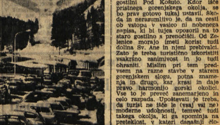
Na ljubeljskem obmejnem prehodu

Zičnica je razdeljena na dva dela: najprej se pelješ do Vrtače (1291 metrov), nato pa prestopiš in po vsega 14 minutah dosežeš vrh (1544 metrov), kjer je zgrajen nov planiški dom z dobro opremljeno avstrijsko zimsko središčem, saj je le 27 km oddaljena od Celovca ter 50 km od Ljubljane. Sneg traja tu do pomnega poletja, in ker je smučišče dovolj, bodo prav gotovo tudi Tršačani vzljubili Zelenico.