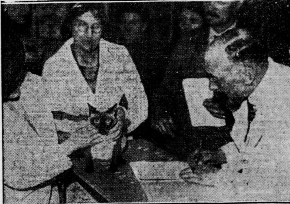
V wagramskih dvoranah v Parizu imajo trenutno razstavo mačk. Na zgornji sliki vidimo nekatere izbrane primerke, spodaj pa komisijo, ki jih ocenjuje