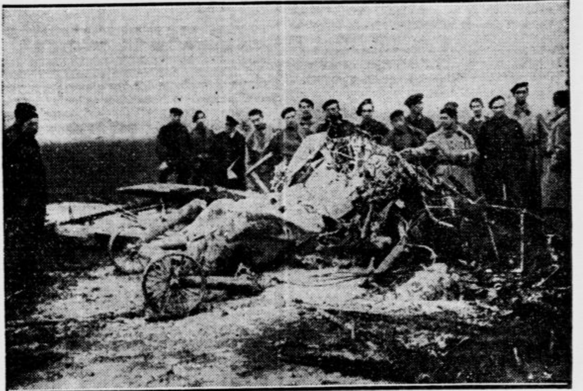
Na letališču Le Bourgetu pri Parizu se je te dni zrušil na zemljo vojaški aeroplan, ki je zgorel do ogrodja pred očmi letališkega osebja