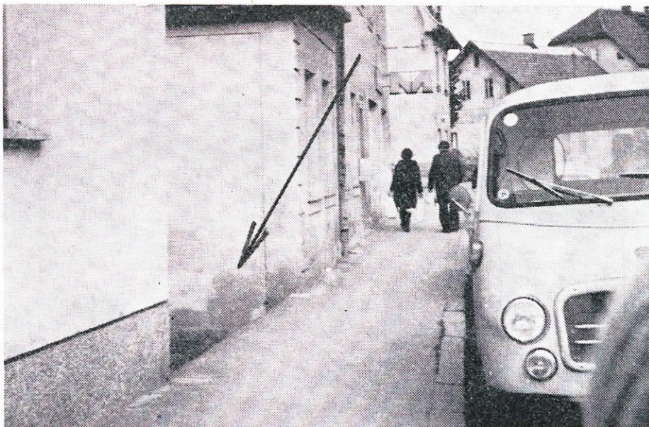
Med Kavškom in Lapom se da kar globoko pasti — ob pločniku namreč ni zaščitne ograje.