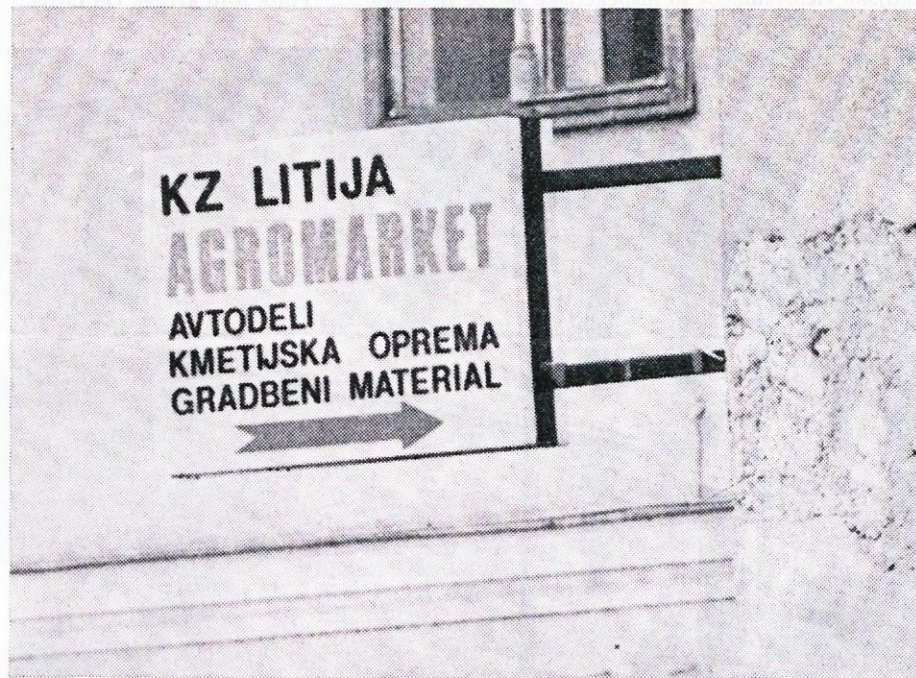
Ali niso slovenske besede lepše in bolj razumljive?