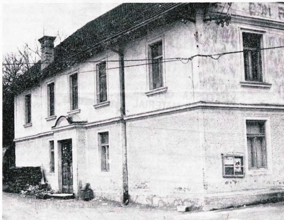
... šmarska, ki je sedaj edina v občini, pa ni nič boljša.