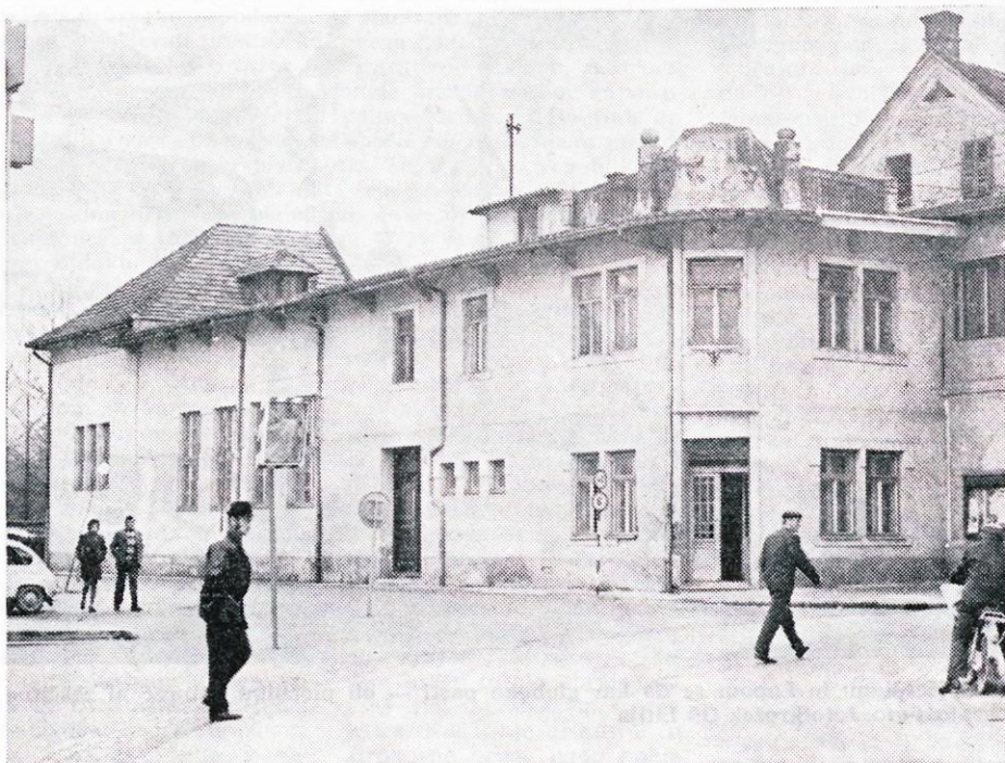
Litijsko »telovadnico« so inšpekcijske službe že zaprle...