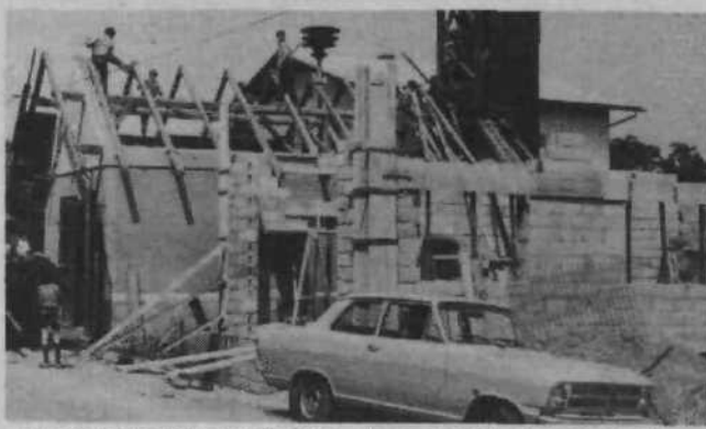
DRUŽBENI DOM V BERIČEVEM – Namesto 85 let starega gasilskega doma bodo v Beričevem zgradili družbeni dom, kjer bo prostor za gasilce, krajevno skupnost in družbenopolitične organizacije.

SLAVNOSTNA SEJA – Člani osnovne organizacije ZSMS so v počastitev 11. kongresa ZKJ na slavnostni seji predsedstva obravnavali delo mladih komunistov v ZSMS. Ugotovili so, da morajo mladi komunisti postati idejno in akcijsko jedro osnovne organizacije, njihovo delo pa se mora stalno kazati v konkretnih akcijah.