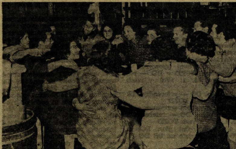
V emajlirnici je bilo prijetno, prepevali so, da je bilo veselje na najvišjem nivoju...

1. TOZD tovarna frit — predelava nekovinskih rudnin in to proizvodnje kremenčeve moke, živčeve moke, emajlov, frit in glazur za jekleno pločevino, litino in keramiko.