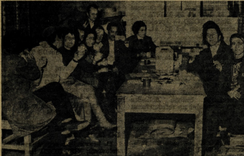
V montaži so si privoščili dobro kapljico, da je bilo razpoloženje na višku...