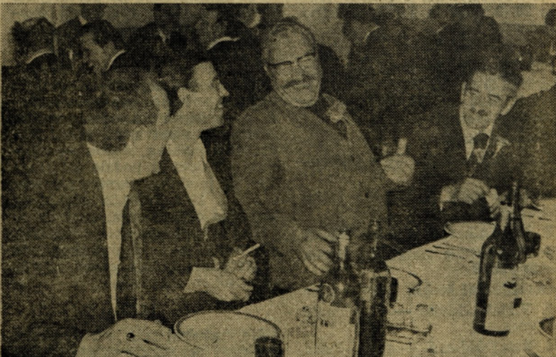
Marsikaj so si povedali, bilo je mnogo humorja in prijetnega razpoloženja, tako kot kaže gornja slika.