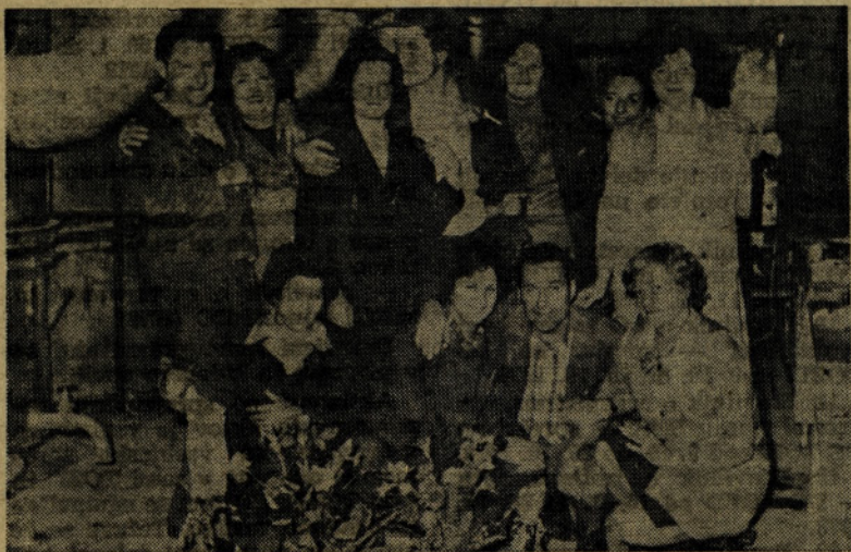
V dekor oddelku je bilo tako kot drugod veselo razpoloženje. Ko je prišel naš fotoreporter, so se postavili v pozo, kot vidite na sliki...