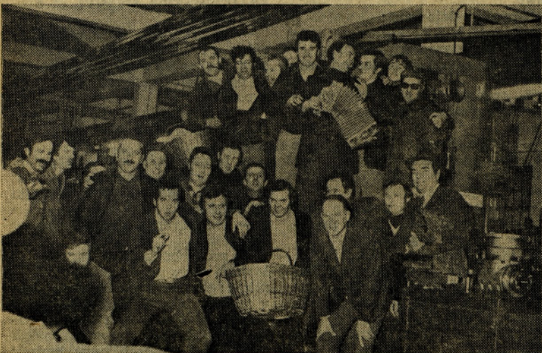
Tudi v TOZD orodjarna so se veselili. Ob zvokih harmonike so malo zapeli...