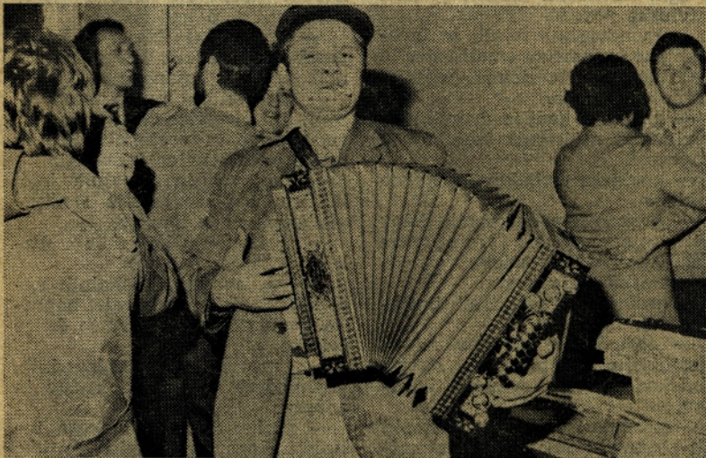
Tale možakar je pridno raztegoval harmoniko v pripravi dela. Plesali so, bili so sproščeni...

Star običaj, da se zadnji dan dela ob zaključku leta malo povešimo in da naš Emajlirca prikaže tako veselje tudi v sliki. Čeprav zaključek leta v nekaterih TOZD ni bil tako uspešen, kot je bilo pričakovati, veselje ni izostalo. No, saj je prav tudi tako. Zakaj se ne bi malo povesečili!? Morda bo ob koncu letošnjega jubilejnega leta veselje še večje, saj upravičeno pričakujemo, da bomo na podlagi lanskih izkušenj dosegli več kot doslej.