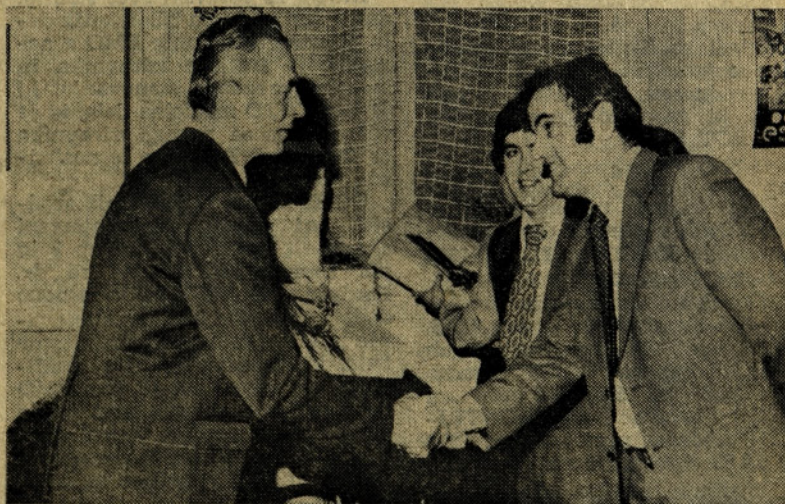
Vsak je prejel lepo darilo, prijazen in topel stisk roke v zahvalo za dolgoletno zvestobo delovni organizaciji.