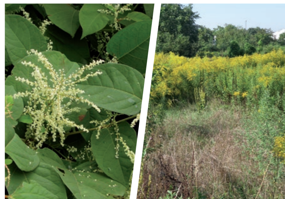
Japonski dresnik (levo) in kanadska/orjaška zlata rozga (desno) Japanese knotweed (left) and Canadian/giant goldenrod (right)