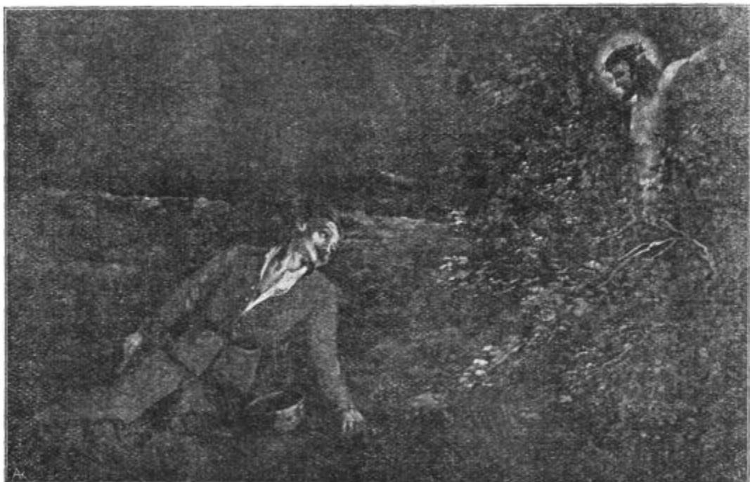
Še danes boš z menoj v rajū...

sproti milemu Jezusu. Ona je prva ustanovila zares prelepo, vzvišeno in tako zveličavno »Društvo pravih ljubiteljev Jezusovih«. H tej družbi more vsak pristopiti: otroci, mladeniči in dekleta, očetje in matere, starčki in starke, bogoslovci in mašniki, osebe ki žive v svetu, redovniki in redovnice in člani vseh že obstoječih družb (bratovščin). Da kdo postane ud te družbe, ni potrebno, da bi se njegov ime komu poslalo ali vpisalo v kako knjigo; zadostuje,