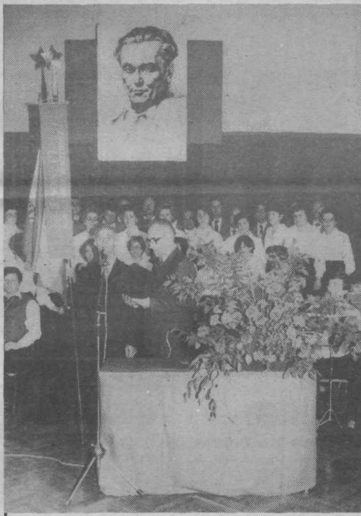
Na proslavi so razvili papir KO ZB NOV Moste