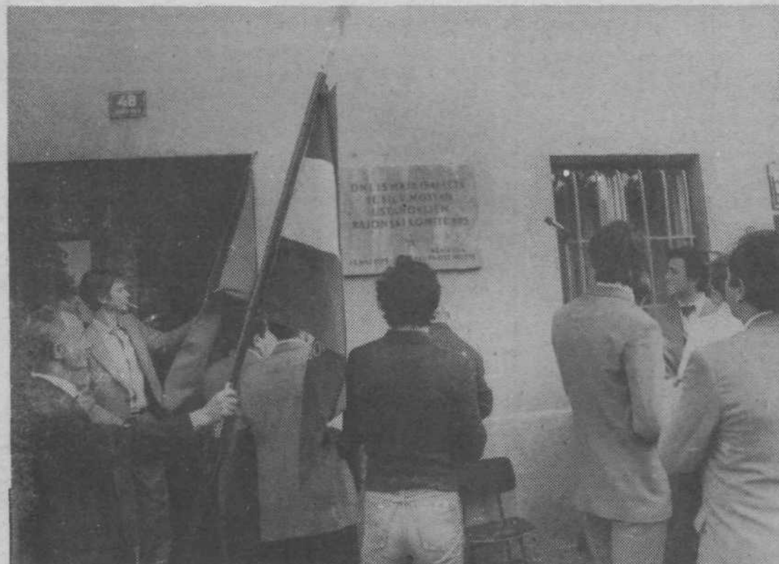
Pred vhodom v poslopje KS so odkrili ploščo v spomin na 15. maj leta 1941, ko je bil v Mostah ustanovljen rajonski komite KPS