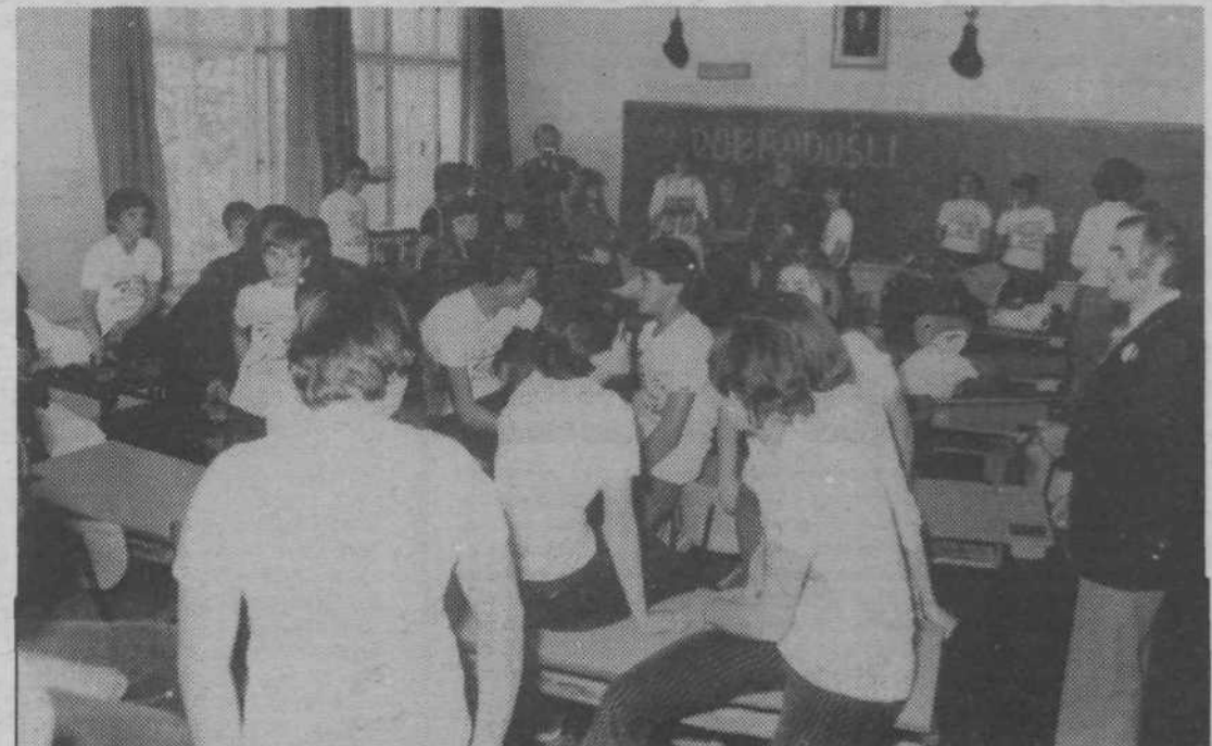
Ura prijateljstva je bila prekratka za vse, kar so si imeli povedati