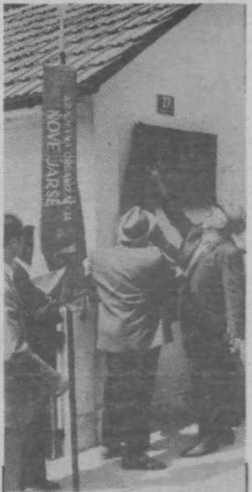
Na pročelju Nakrstove hiše v Kodrovi ul. št. 27 so odkrili ploščo v spomin na pokrajinsko konferenco KPJ za Slovenijo pred dobrimi 50. leti