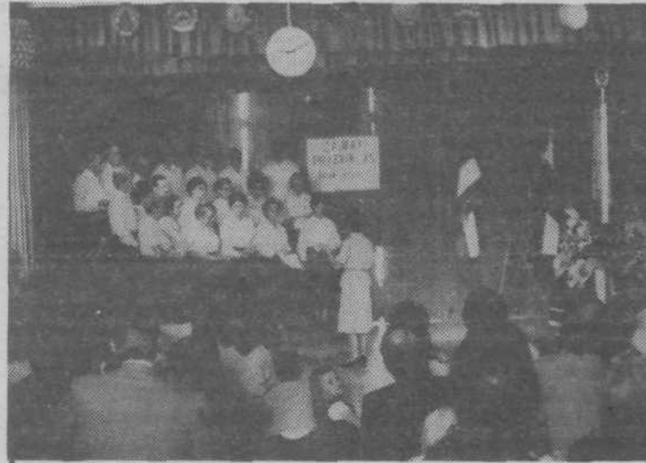
Mešani pevski zbor se je prvič predstavil na proslavi krajevnega praznika

O 27. maju, prazniku KS Nove Jarše, pišemo na 10. strani. Tu objavljamo le posnetka s praznovanja.