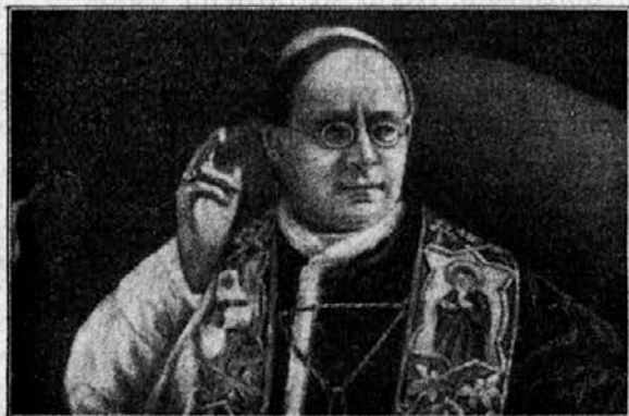
Papež Pij XI.

Solnce je sijalo s toplim žarom z jasnine — — —