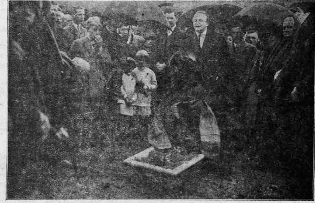
LJUBLJANSKI PROLETARIAT NA GROBU ENE IZMED 14 PADLIH ŽRTEV ZALOŠKE CESTE 22. APRILA 1928.

Pri »Lloyd« v salonu, pri firkljčkih in litrih, so se v soboto zvečer birokrate ljubljanske SSJ spominjali Zaloške ceste. Bilo je zelo letno . . . V nedeljo pa, ko so delavci, tudi socialisti, šli na pokopališče, se je birokracija SSJ z godbo in vozovi pomikala po Dunajski cesti na izlet v Gamelje, kjer imajo dobre klobase in sijano kapljico. Ponoči se je ena skupina izletnikov vračala, s svojo himno: »Prej pa ne gremo dam, da se bo delal dan . . .«