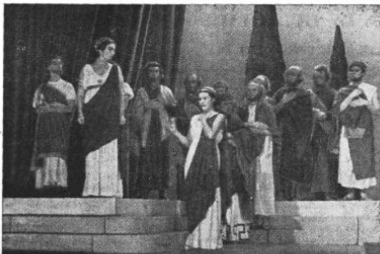
Prizor iz »Antigone«. Delo igrajo z velikim uspehom v Narodnem gledališču v Ljubljani. Posnetek je napravil g. Lojze Šmuc. Ljubljana, Aleksandrova.

Zdaj spomnim zgodbe se o Tantalovi hčeri: okrutne smrti, ki jo je umrla vrh sipalskih čer, ko v živo skalo, ki rastle okrog nje je kot bršljan, vkovano dež razjedal je in pral, ne loči sneg od nje se, kot vele — in izpod obrvi ji noč in dan