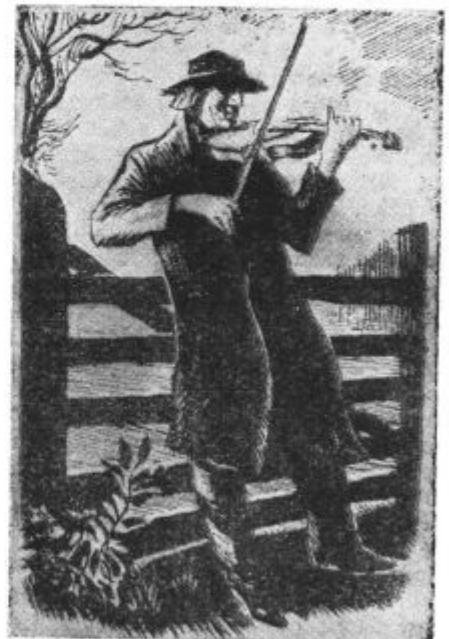
Igralec na gosli.

V boju med Tebanci in Argijci sta padla vsak na eni strani Polynejk in Eteokel — sinova tebanskega kralja Oidipa in njegove matere in žene Jokaste. Po bratomornem boju sta ostali žalujoči hčeri Oidipovi in sestri Polynejka in Eteokla — Antigona in Izmena. Kreon — njun stric — je