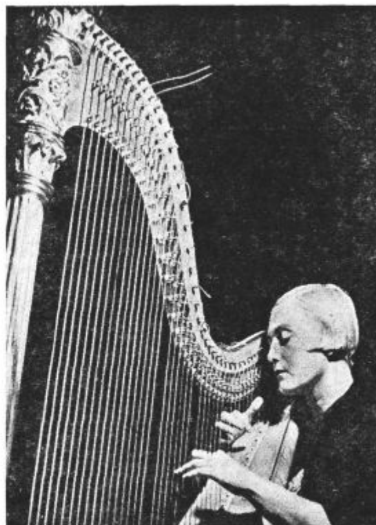
Igralka na harfi.

Valovi okrog 15 m so tako imenovani dnevni valovi. Postaje okrog te valovne dolžine moremo čez dan razločno slišati. Valovi okrog 25 m so