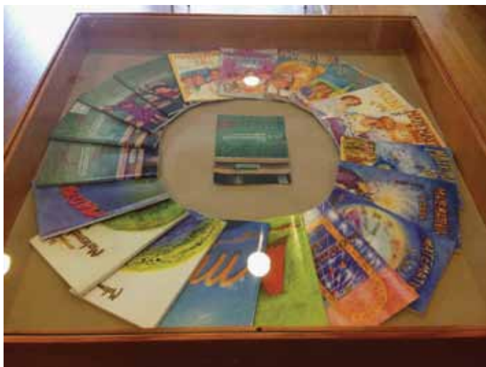
[Slika 1] Devetnajst letnikov zbranih v krogu, 20. letnik v sredini

Se spomnite naslovnice katere izmed revij Matematike v šoli, ki so izšle v vseh letih njenega izhajanja? Imate morda (vse številke) revije spravljene v šolski knjižnici, svojem kabinetu, zasebni knjižnici? Jih kdaj prelistate, uporabite zapisano vsebino pri strokovnem delu, pri poučevanju, pri pisanju prispevkov za matematično konferenco ali ob pisanju prispevkov s področja matematike za druge konference, npr. SirIKT?