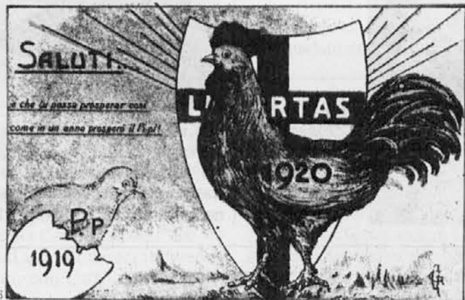
"...E che tu possa prosperar così/come in un anno prosperò il Pi-pi": un simpatico manifesto del Partito Popolare del '19

La crisi sociale e politica del primo dopoguerra impose il suffragio universale.