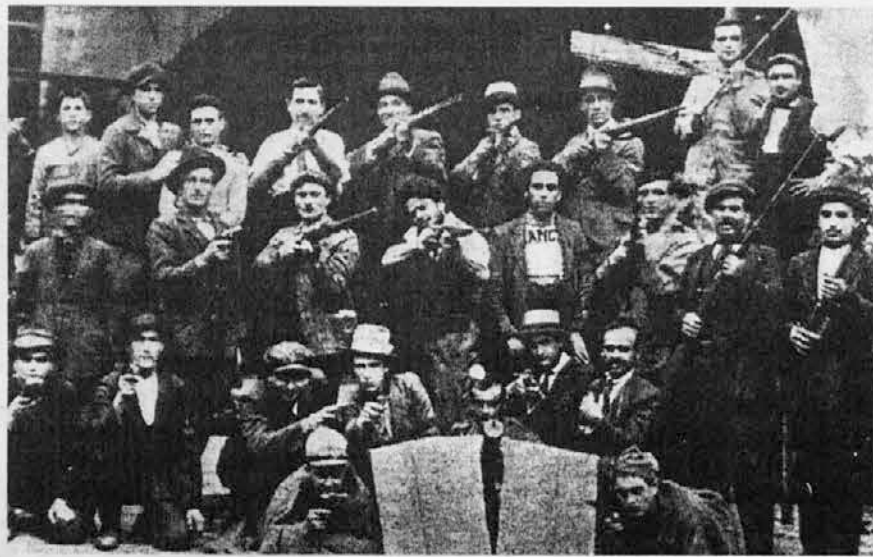
Le "guardie rosse", operai armati che nel 1920 occupavano le fabbriche: occupazione della "Lancia"