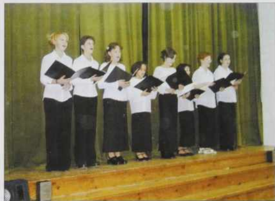
Nastop pevskega zbora

9.10.11. julija so bili na prauški/romanji v Sloveniji na