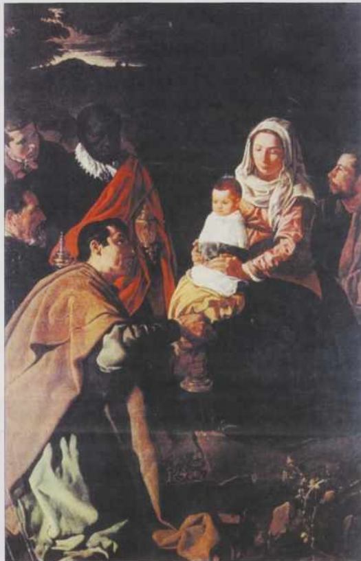
Diego Velazquez: Molba kralov

različnih gotskih ino renesančnih oltarskih slikaj, freskaj, vsepovsedik vidimo, ka je mali Jezuš centralna figura na vsakšem kejpji, ali tak ka se nahaja na srejd