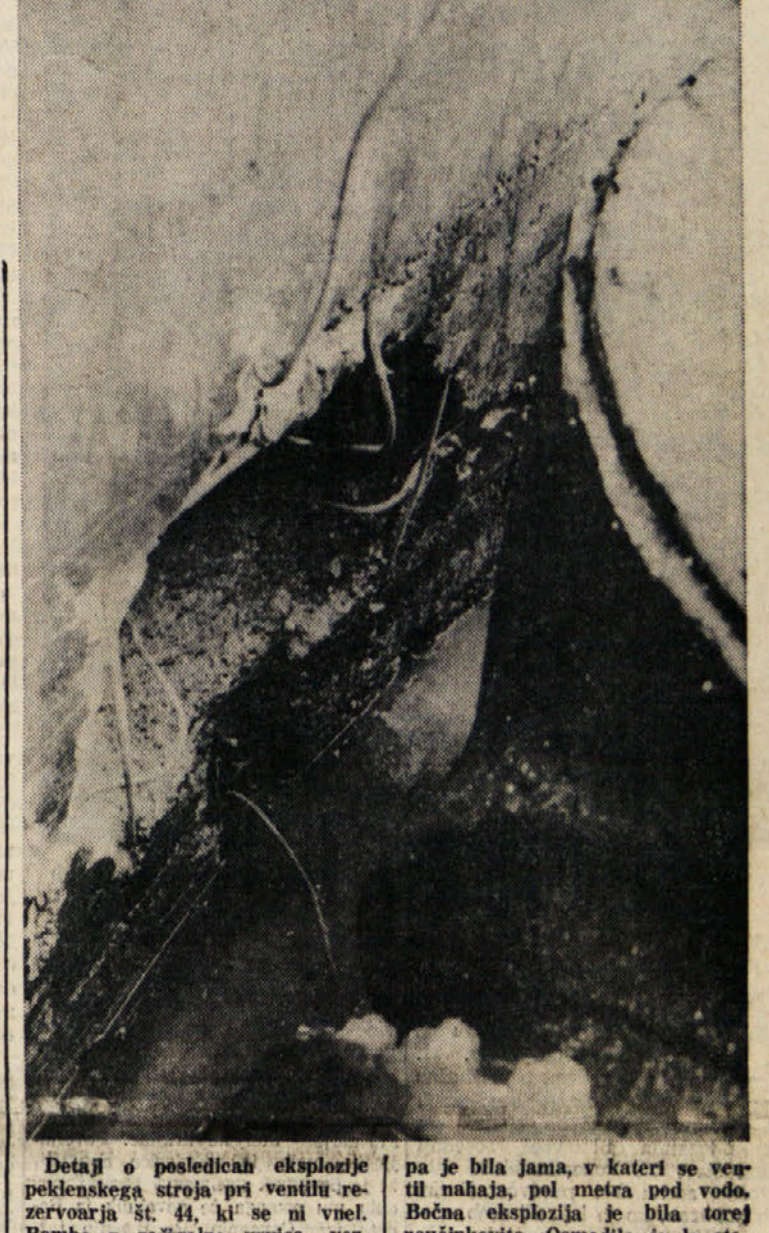
Detajli o posledicah eksplozije peklenskega stroja pri ventilu rezervoarja št. 44, ki se ni vžgal. Bomba z zažgalim vrvice, verjetno pet do šest kg trotila, je atentator naslonil na steno in železne kable, ki jih je eksplozija presekal. S tem je zagrešil napako, ki je efekt eksplozije popolnoma nevtralizirala. Druge pek- lenske stroje so namreč atenta- torji položili pod ventili, ki uvaja nafto v rezervoar. V tem primeru