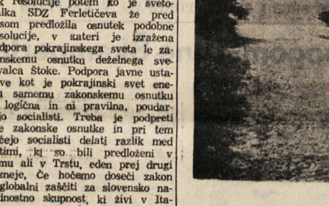
Začetek urejanja ceste pri Jazbinah

V teku so dela za ureditev briške ceste od Dolenj mimo Plešivca in Jazbin do Steverjana. Dela vrši po nalogu pokrajinske uprave v Gorici podjetje Tacchino. Na odseku med pokrajinsko cesto Krmin - Dolenje in Plešivom so zemeljska dela že pri kraju. Na cestiščih morajo sedaj položiti prvo asfaltno plast, na katero bodo pozone, ko bo vsa cesta dokončana, položili še vrhno asfaltno plast.