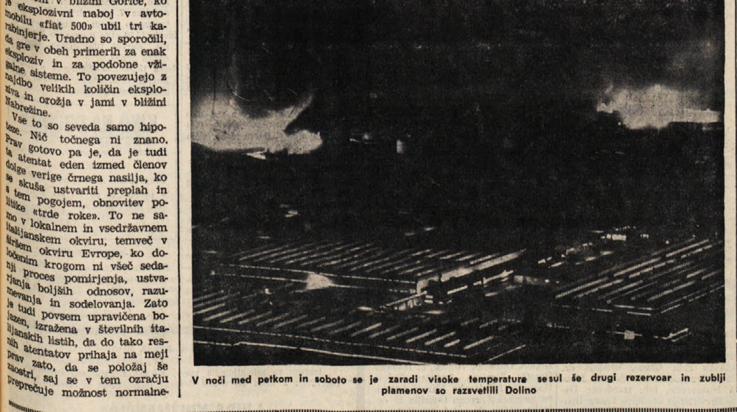
V noči med petkom in soboto se je zaradi visoke temperature sesul še drugi rezervoar in zublji plamenov so razsvetlili Dolino