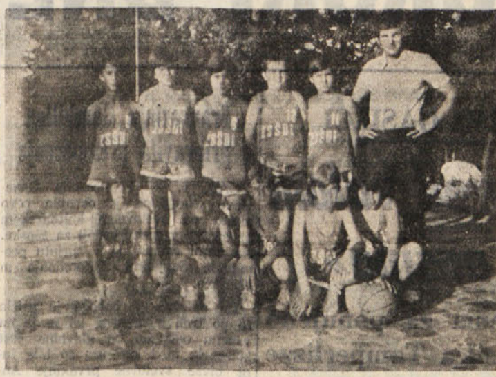
Ekipa ZSSDI, ki bo nastopila na turnirju v minibasketu na tržaškem stadionu Grezar

zaradi ozkih cest vožnja zelo težavna. Kot pred dvema letoma v Leicesteru je tudi v Gavu glavna značilnost proge veter. Ta piha brez prestopanka z Atlantskega oceana in bo tako precej oviral kolesarje pri vožnji.