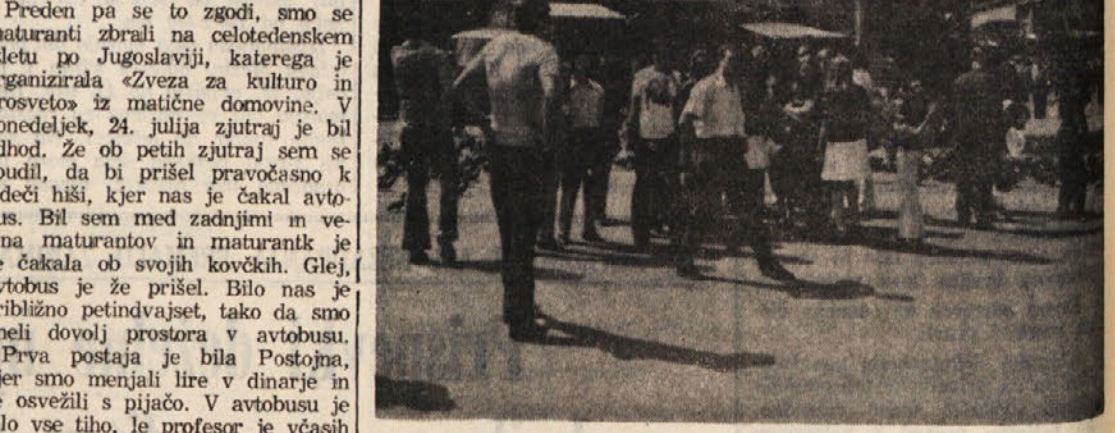
Štupina goriških maturantov v Sarajevu

Na izletu so bili maturanti liceja, učiteljska in trgovske šole