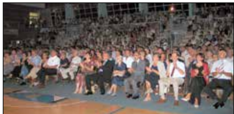
Navdušeno občinstvo oziroma bodoči zvesti bralci Železnih niti.