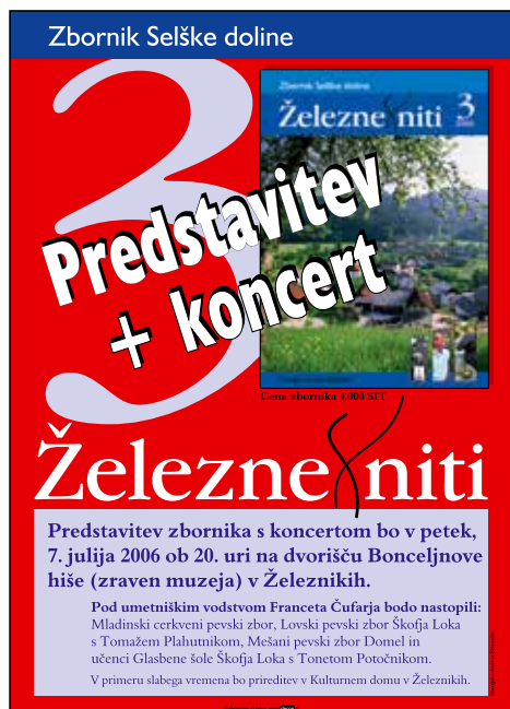
Plakat, ki je vabil na predstavitev tretje številke zbornika Železne niti.