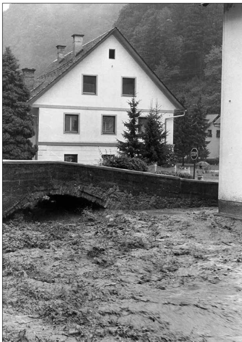
Poplave 8. 9. 1995. Deroča voda pod mostom na Klovžah.