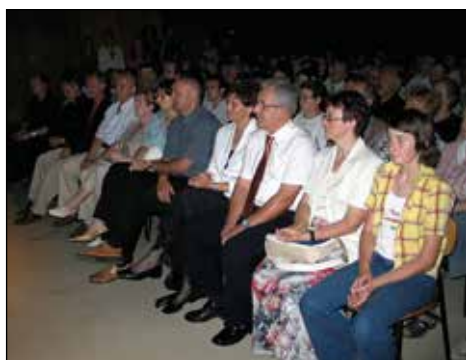
Zvesti bralci in pozorni poslušalci.