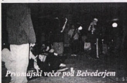
Prvomajski večer pod Belvederjem

Seveda imajo sindikalisti vso pravico, da organizirajo takšno praznovanje kot ga želijo, toda komercializacija mednarodnega delavskega praznika na ceno njegovega političnega naboja je lahko tudi dvorezen meč. Če se na sam praznični dan ne bi vreme tako skisalo bi se namreč lahko zgodilo, da bi bilo na Socerbu več delavcev kot v Simonovem zalivu, čeprav tam ni bilo nobene organizirane proslave, z izjemo tiste, ki jo je na predvečer praznika pripravil koprski MKC. In potem bi se lahko zgodilo, da bi spet vihrale rdeče zastave, da bi se pojavila srp in kladivo in bi bilo morda slišati tudi Internacionalo. Sicer pa smo to že nekje prebrali: če se ne motim v eni od črtic Prežihovega Voranca. Morda ne bi bilo slabo, da bi jo sindikalisti ponovno vzeli v roke.