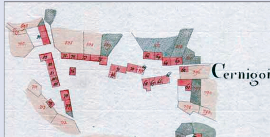
Zaselek Črnigoji pri Stomažih iz leta 1822