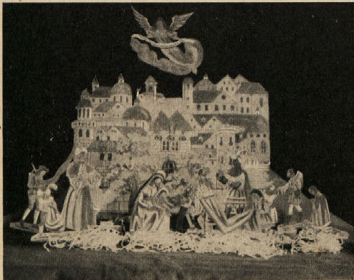
Papirnate jaslice iz začetka 19. stoletja. Z roko barvane. Prizor s sv. Tremi kralji. (Last ge. S. Golieva.)

uvrstiti v nobeno izmed pravkar opisanih serij. Dva kralja imata mogočen turški turban na glavi in stojita, tretji pa kleči.