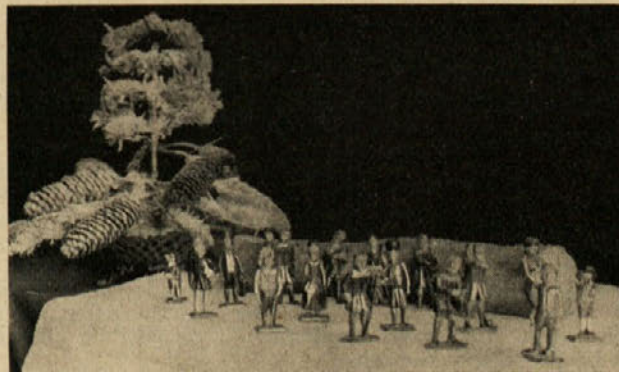
Druga skupina podob iz plastičnih jaslíc, katerih del je na prejšnji sliki.