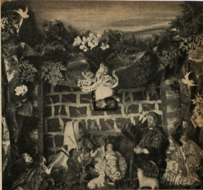
Izrezek iz uršulinskih omaričnih jaslíc. Podobe voščene, papirnati pastirci so poznejši dodatek. (Last ge. S. Golieva.)

Vse bolj bogate, dasi gotovo novejše, pa so izrazite baročne omarične jaslice iz leta 1714, ki so last inž. arch. Simona Kregarja. Voščene figure so razmeroma velike, zato v omari ni dopuščajo velikih in številnih skupin. V teh omaričnih jaslich pa imamo papirnate figure, oblečene v svilo. Sredi omarice stoji lesen hlevček s streho in oknom, za katerim je vdeleno v zadnjo steno majhno ogledalce. Od hlevčka do sprednjega desnega in levega vogala je postavljen papirnat plot. Za njim pa je pritrjeno na vsaki strani podolgovato ogledalce. Na nasprotni strani vsakega platu je namreč naslikana panorama pokrajine, ki nato odseva v zrcalcih. Nad hlevčkom in obema zrcalcema se dviga skalovito hribovje, izdelano iz papirja, pomazanega s klemjem in posipanega s temnorjavim prahom. Na njem je nalepljeno na vrhu mesto Betlehem z obzidjem, tu pa tam kakšna posamezna cerkva ali hišica ali drevo ali plot, videti je majhne postave pastirjev in kmetic, ki nosijo razne tovore na glavi ali na hrbtu. Vse to je naslikano na papir in v obrisih izrezano. Sedem večjih figur v hlevčku in okoli njega pa je, kakor rečeno, skrbno oblečenih. Obrazi teh figur so nam znani z ne-