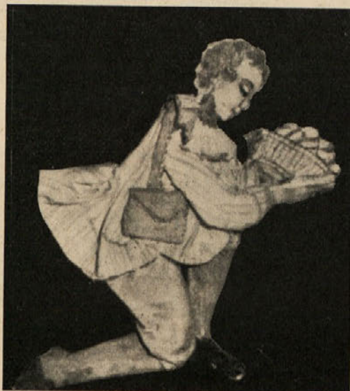
Klečeči pastir. Iz omaričnih jaslic iz leta 1714. Podobe iz papirja, obleka svilena. (Last ing. arch. S. Kregarja.)

iz papirja, prevlečenega s klejem iz posipanega s peskom in steklenim prahom. Videz narave povzdigujejo drobne umetne cvetlice, umetne ali spretno posušene rastline in celo ptice. Včasih so nalepljene na »skalovje« manjše papirnate hišice, plotovi, drevesa. Obe stranski steni in strop se stikajo perspektivno in so navadno pozlačeni. Prednjo steno tvori steklo.