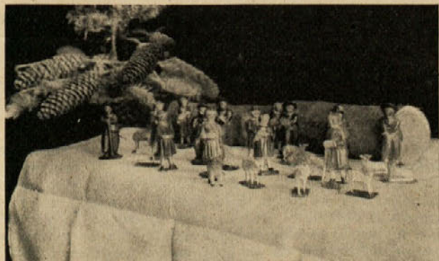
Leseni poslikani pastirci iz plastičnih jaslíc. (Last ge. S. Golieva.)

Gospa Golieva ima tudi večje število lesenih pastircv, med katerimi ločim dve vrsti različnega izvora. Eno vrsto označuje izrazito tenka, skoraj gotska linija života, za druge pa so značilne rumene dokolenske halje. Od kod in od kdaj so, ne morem dognati. Prav zanimivi pa so sveti Trije kralji, ki jih ne morem