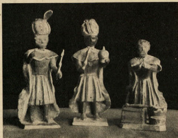
Sveti Trije kralji iz plastičnih lesenih jaslíc. (Last ge. S. Golieva.)

Dete, tesno v plenice povito in na lep čipkast prtiček položeno. Ta način predstavljanja Jezuščka (v nemških alpskih jaslích nazvan »Fatschenkind«) sega že v 9. stoletje in šele poznejši barok uvede bosiranega Jezuščka z razprostrtimi ročicami. Nad hlevčkom plava ljubek angelček z napisom »Gloria in excelsis Deo«. Okrog in okrog je vse okrašeno z umetnim cvetjem in posušenimi rastlinskimi listi, ki se med njimi spreletavajo drobni ptički. K jaslični skupini sta morda spadali tudi obe ovčici, papirnate pastirčke so prilepili dosti pozneje in ne spadajo zraven.