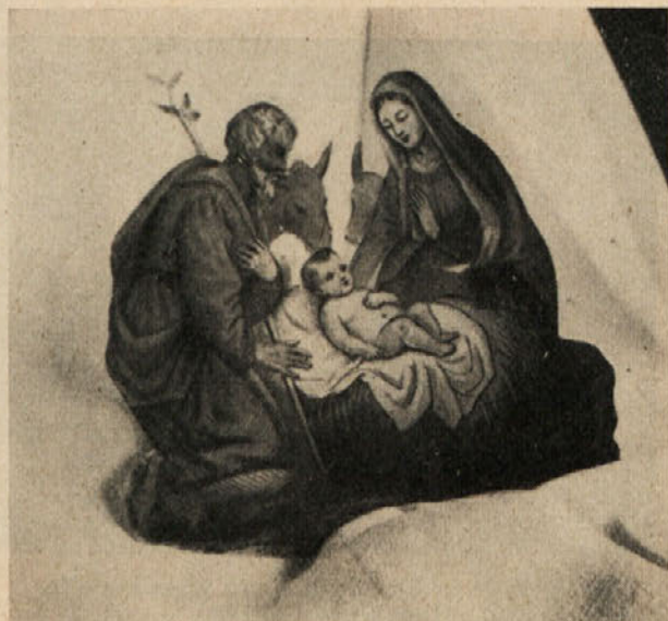
Papirnata jaslična skupina. Risba s tušem ročno poslikana z vodnimi barvami. Neznani slikar iz 19. st. (L. ge. Golieva.)

S slikanjem papirnatih jasličnih figur se je pri nas ukvarjal Leopold Layer s svojo šolo. Zanimive