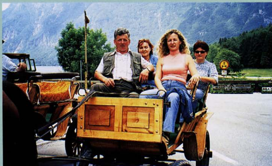
Dame so se odpeljale s kočijami - tokrat brez vitezov

blagodejen občutek, da smo sodelavci lahko tudi prijatelji in da je delo v okolju, kjer vladajo dobri odnosi, lažje in prijetnejše. Pa tudi rezultati so boljši. Vredno se je potruditi. ●