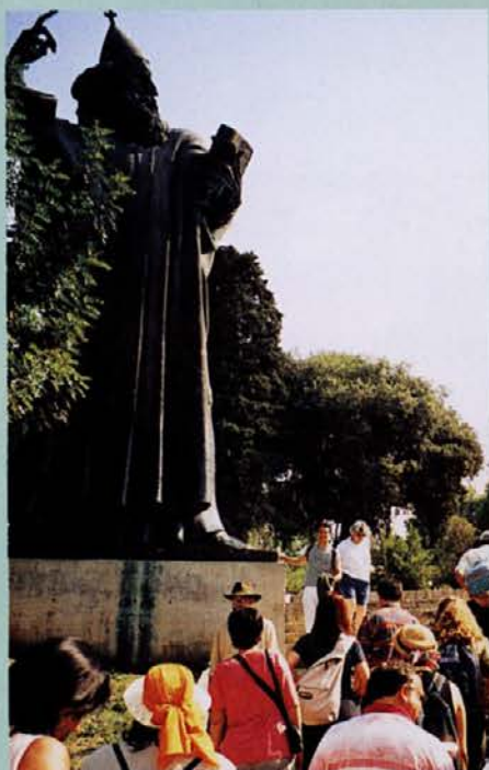
Grgur Ninski s kazalcem v zraku vsem rodovom sporoča, da je vse minljivo - tudi čast in bogastvo Dioklecijana...