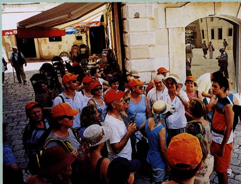
V Dubrovniku sta nas po mestu popeljali dve odlični vodički. Slišali smo veliko zanimivega o daljni preteklosti in tudi o dogodkih iz novejšje zgodovine, ki jih je Dubrovnik doživel in srečno preстал po razpadu prejšnje Jugoslavije