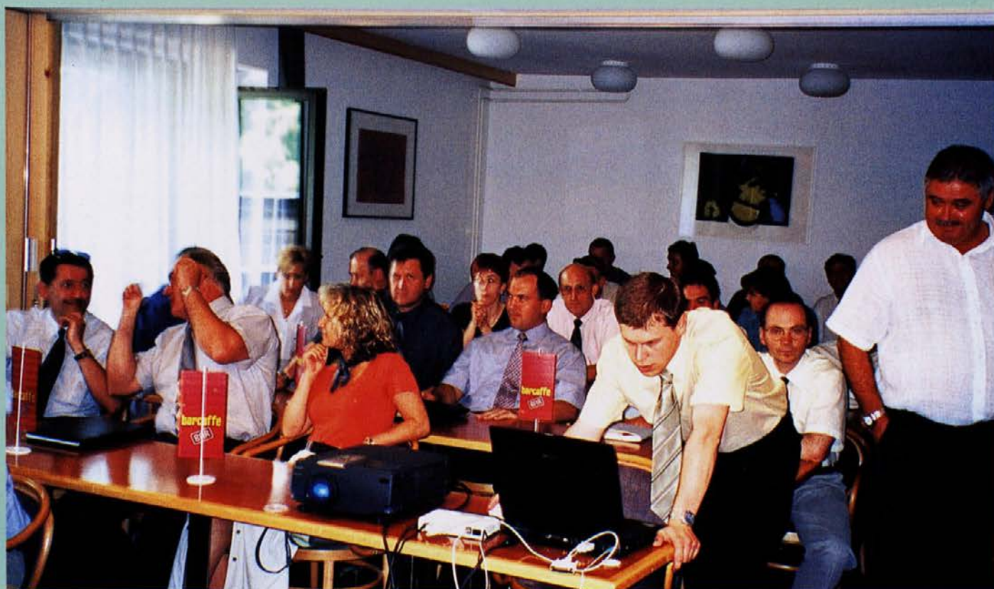
Delovno vzdušje v hotelu Jezero