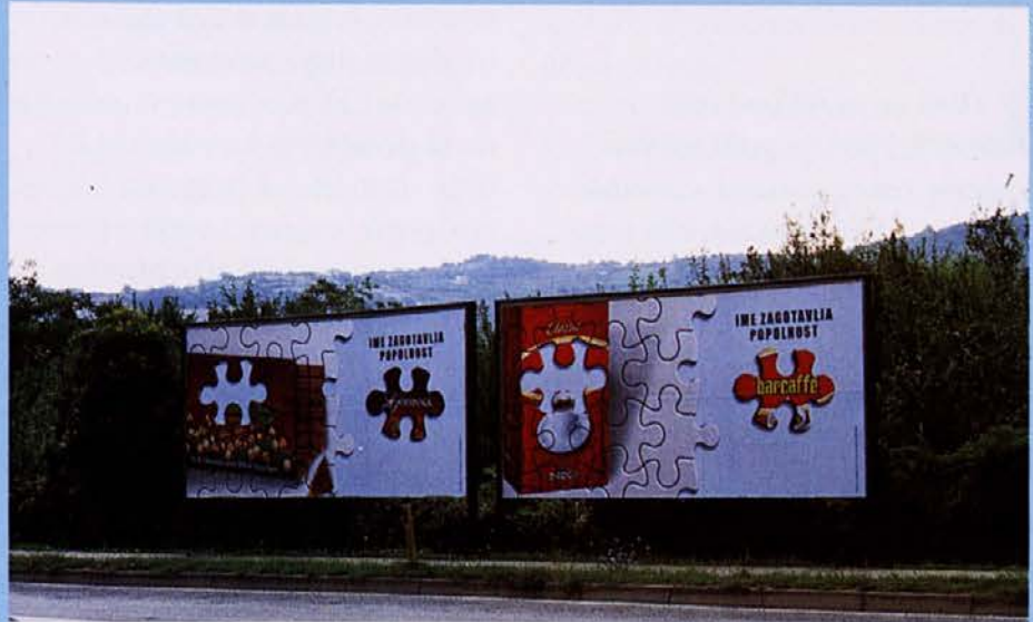
Primer skupnega nastopa na trgu odličnosti

Glavni namen akcije Ime zagotavlja popolnost je promocija že uveljavljenih blagovnih znamk in oblikovanje zavesti o pomenu blagovnih znamk med potrošniki in podjetji. V oglaševalski akciji, ki zajema 1100 plakatnih mest, sodeluje 15 naročnikov: Diners, Paloma, Gorenjka, Zeppter, Natren, alpsko mleko Ljubljanskih mlekarn, Perutnina Ptuj, Radenska, Žito, Barcaffè (Droga), Gorenje, Delo, Mura in paštete Gavrilovič. Akcijo je zasnovala agencija Studio Marketing J.W.T., ki je tudi oblikovala enostavno rešitev. Na vsakem plakatu je predstavljena sestavljanka, na kateri manjka ključni delček. Manjkajoči delček z logotipom je postavljen poleg sestavljanke. Pospremljen je z napisom (sloganom): Ime zagotavlja popolnost. Na ta način smo želeli poudariti, da je blagovna znamka porok kakovosti izdelka. Hkrati pa so v akciji uglede blagovne