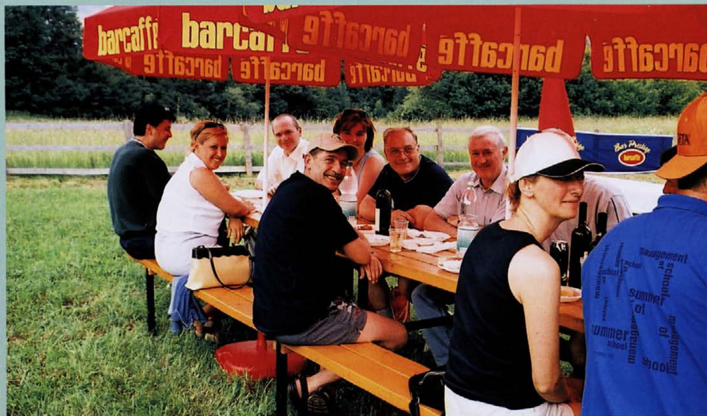
Še tako resna stvar ima tudi svojo veselo plat...