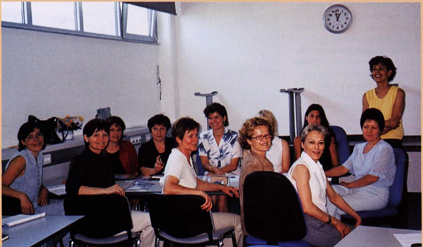
Sijoči obrazi pričajo, da je bila delavnica prijeten dogodek

Delavnice na žalost nismo mogle zaključiti, ker smo vmes izvedele za tragično novico, tako da bomo z usposabljanjem nadaljevale jeseni. ●