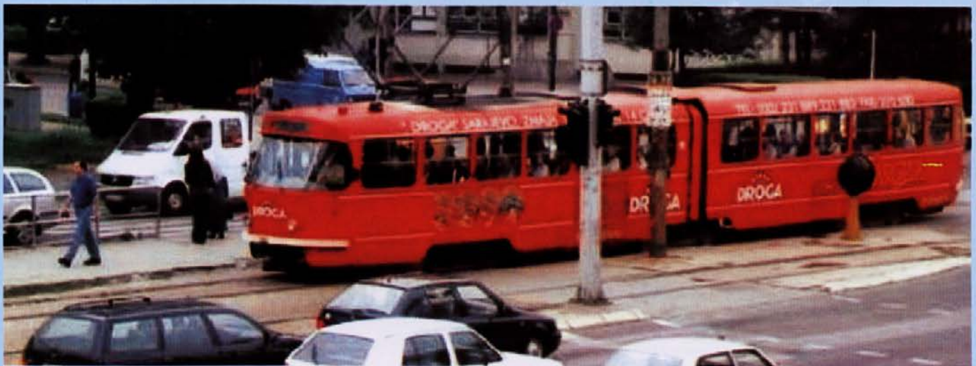
Leteča reklama v sarajevskem mestnem prometu