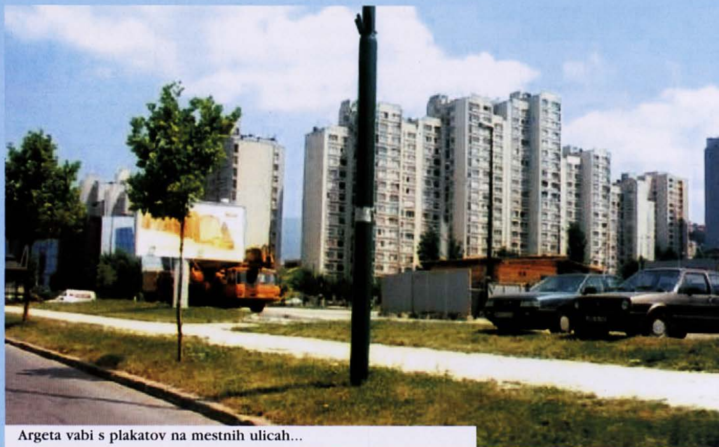
Argeta vabi s plakatov na mestnih ulicah...

Zaključeni sta obe Argetini nagradni igri, namenjeni otrokom: Osvojimo 222 nagrad Argete Junior, ki je bila organizirana v objektih Konzuma, in nagradna igra Osvojimo 10 košarkaških žog Argete Junior, organizirana v otroškem časopisu Male novine. Kuponi so prihajali z vseh področij BiH, tako da ➤