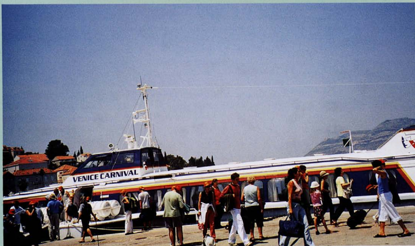
Gliser Venice Carneval nas je pripeljal v Split