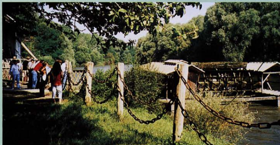
Mlin na Muri še stoji. Tega dne ni mlel, lastnik ga je popravljaj. A Mura je popotnike prijetno ohladila.

◀ prekinila, zato jih lani ni bilo. Letos pa smo se drogovci zopet dogovorili in organizirali kar dva izleta - po Jadranu do Dubrovnika in na Štajersko in Prekijo, do Ljutomerja. Lahko bi zaključili z znanim rekam: kar se Janezek