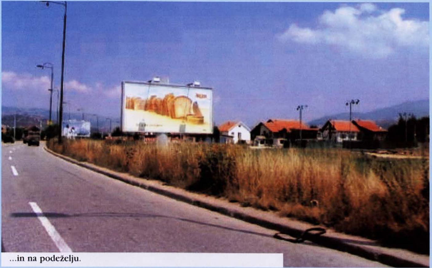
...in na podeželju.

◀ je v Sarajevu ostala le ena nagrada. Ostale nagrade so bile podeljene otrokom iz Travnika, Fojnice, Cazina, Bihača, Tuzle in od drugod.