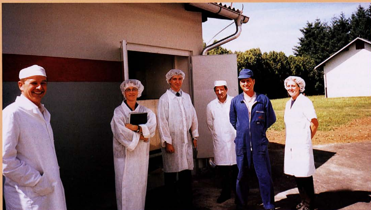
PC Gosad: Povsod jih je bilo zadosti, največ časa pa so posvetili čistilni napravi, kjer so "obdelali" tudi vodjo vzdrževanja.

◀ neskladja, ki pa so v času pisanja tega članka že v postopku odpravljanja.