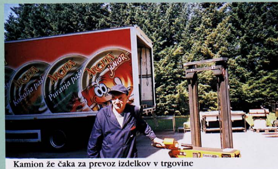
Kamion že čaka za prevoz izdelkov v trgovine

Da je dela še več, so tu še dopusti, povečan obseg dela zaradi sezonske predelave vrtnin, razne odsotnosti ipd. Vse se zdrži, potrpežljivi do sodelavca moramo biti, si med sebojno pomagati in se razumeti. ●