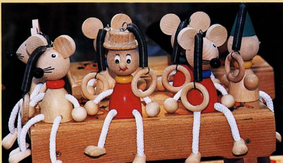
Lesenko: "Ne, mi nismo strankarski funkcionarji, mi smo zares čisto prave lutke!"

P.S. Pred objavo današnjega odlomka smo skrbno preverili dejstva in lahko nam verjamete, da je prvi del pisanja precej blizu resnici, o pripetljaju tovariša K. pa ne gre niti malo dvomiti... ●