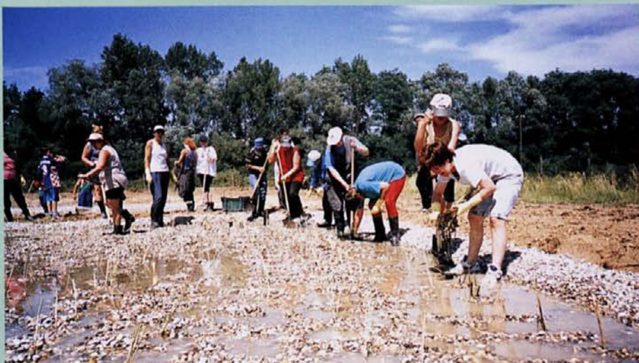
Nevsakdanji prizor: sajenje trstike v rastlinski čistilni napravi.