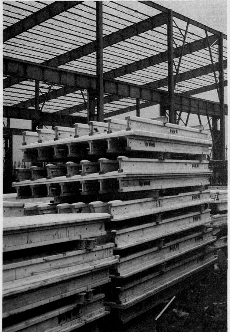
V jeklarni 2 na Jesenicah — opaž za steno LG 100