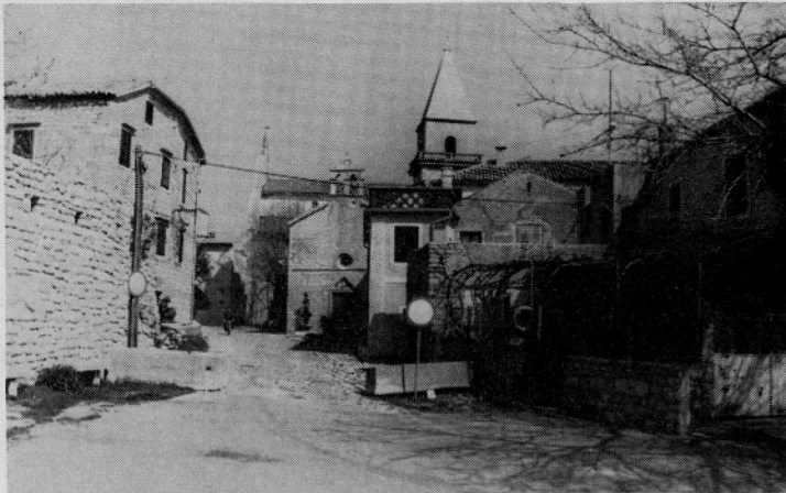
Ribiška vas Osor na Lošinju — Do 15. stol. je bil Osor glavno mestno središče Cresa in Lošinja. Danes je Osor majhno naselje (okoli 100 prebivalcev), iz bogate preteklosti pa je ohranil številne spomenike rimskega in srednjeveškega obdobja. Osor je znan po prireditvi »Osorski glasbeni večeri.«