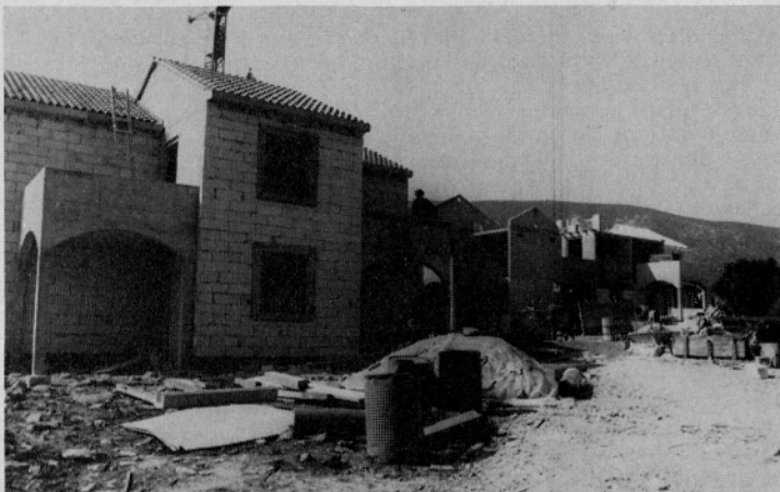
Počitniške hiše že dobivajo pravo podobo