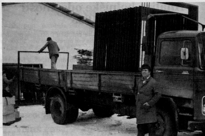
Do nedavnega so bili kovinski podboji sestavljivi del vhodnih in garažnih vrat. Ker pa niso bili na zadovoljivi kvalitetni ravni, smo jih morali zamenjati z lesenimi

Naš sedanji program se prilagaja sprejetemu programu s