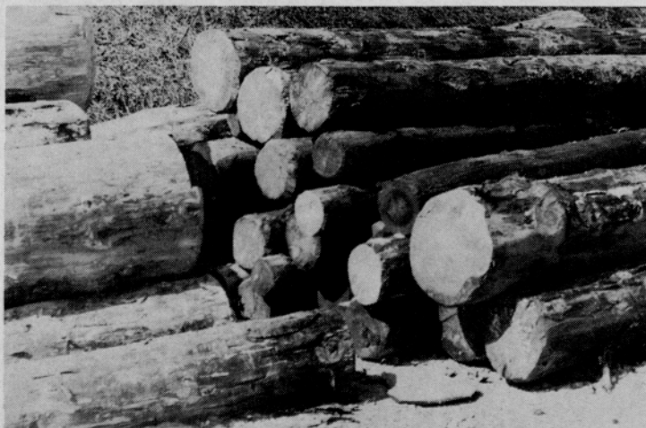
Iz hlobovine, namenjene za žaganje, ki je preležana, rjava do srca, bodo nažagani sortimenti sortirani v četrto — peto kvaliteto