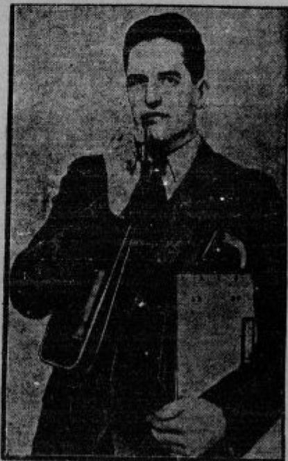
Umetno grlo. V Ameriki so iznašli aparat, s katerim ljudje, ki so izgubili glas, zopet lahko glasno govorijo. Besede delajo usta, jezik in premikajoče se ustnice. Malo cevko vtakne bolnik v usta. Ta cevka je v zvezi z umetnim grlom, ki ga mož drži pod pazduho.