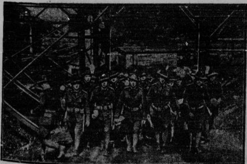
Ameriško vojaštvo proti stavkujočim rudarjem. V premogovnih revirjih Cadiz v severnoameriški državi Ohio se je policija spopadla s stavkujočimi rudarji. Priti je moralo na pomoč vojaštvo.