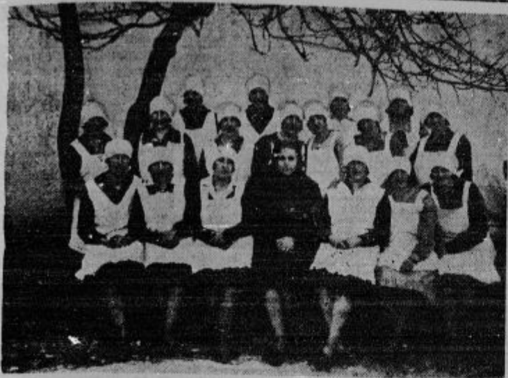
Gospodinjski tečaj v Dragi na Kočevskem pod vodstvom tamošnje g. šolske upraviteljice.