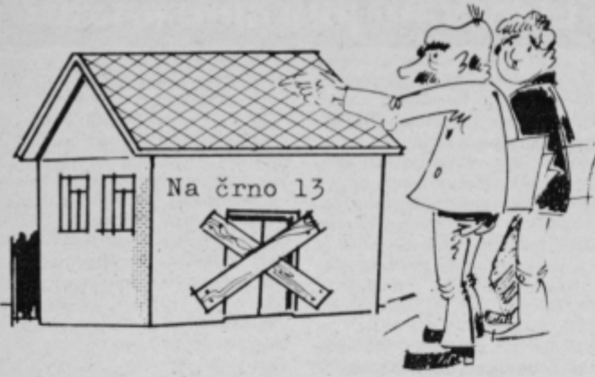
— Očitajo nam, da smo birokrati včasih slepi za probleme graditeljev hiš, toda še nikoli nisem spregledal, če je bila vloga pravilno kolkovana...