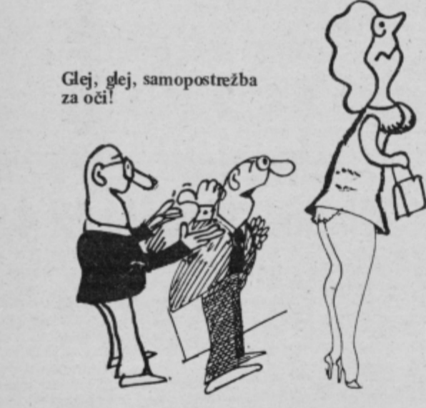
Glej, glej, samopostrežba za oči!