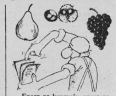
— Enega za krompir, enega za sadje, enega za zelenjavo, enega... ja hudiča, za ozimnico pa mi ne bo nič ostalo...