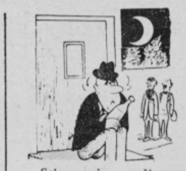
— Saj pravim, poštenemu človeku zaprejo pred nosom celo lastna vrata... hk, je to pravica na svetu!