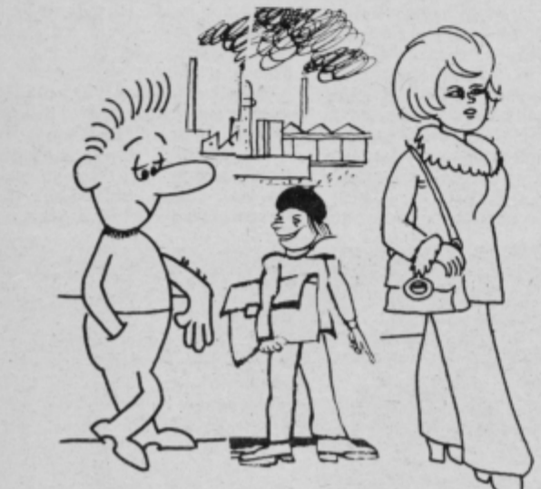
— Se ti dopade moja sestra, kaj? Pa veš, da ona sploh ni tako lepa, ampak samo tako vun vidi...