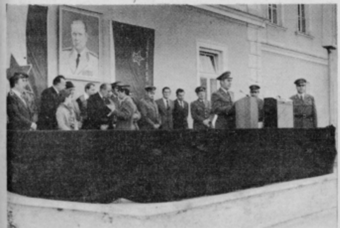
Trenutek iz osrednje svečanosti ob Dnevu artilerije.