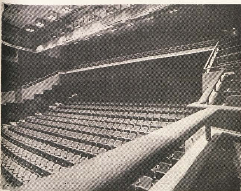
Ena izmed dvoran Cankarjevega doma

svojim otrokom omogočijo, da Mladi rod naročijo. Ena številka Mladega roda stane 5 šilingov, dvojna 10 in letna naročnina 50 šilingov. To je v sorazmerju s tem, kar revija nudi mladim bralcem zelo malo. To pa zaradi tega, ker uredniki urejajo na podlagi idealizma in iz ljubezni do domače slovenske tiskane besede. S tem brez dvoma opravljajo izredno pomembno nalogo v razvoju naše narodne skupnosti. Zato njihovo delo podprimo z naročilom Mladega roda za naše otroke ali pa dom, saj bomo s tem pomagali reviji prebroditi velike finančne težave, naši mladini pa bomo poskrbeli pestro in poučno čtivo, ki ji bo gotovo v korist ob spoznavanju lepote slovenske kulturne zakladnice.