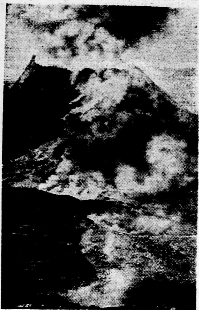
Vezuv je na evropskem kontinentu edini delujoči vulkan. Dviga se v rodovitni pokrajini na obali Neapoljskega zaliva 1168 m nad morje. Za njim točno v smeri od morja sledita samo 50 m nižji ognjenik Monte Comma, ki je pa že ugasel. Med obema ognjenikoma je gorsko sedlo

Vezuv bi lahko dajal toliko energije, da bi bila vsa Italija preskrbljena z elektriko