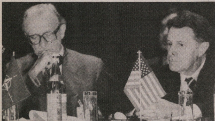
Generalni tajnik NATO lord Carrington in ameriški obrambni minister Weinberger na tiskovni konferenci ob zaključku dvodnevnega zasedanja ministrov »skupine za jedrsko načrtovanje«, ki je potrdilo stališča zahodnega bloka, a hkrati ponovilo poziv SZ, naj se vrne k pogajanjem