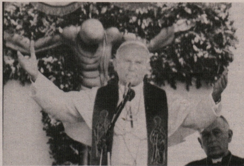
Papež Janez Pavel II. je prispel včeraj iz Španije v srednjeameriško državo Santo Domingo, kjer je sicer obsojil vmešavanje tujih držav, a je prav tako zavrnil »teologijo osvobajanja«, ki je prevzela tamkajšnja ljudstva