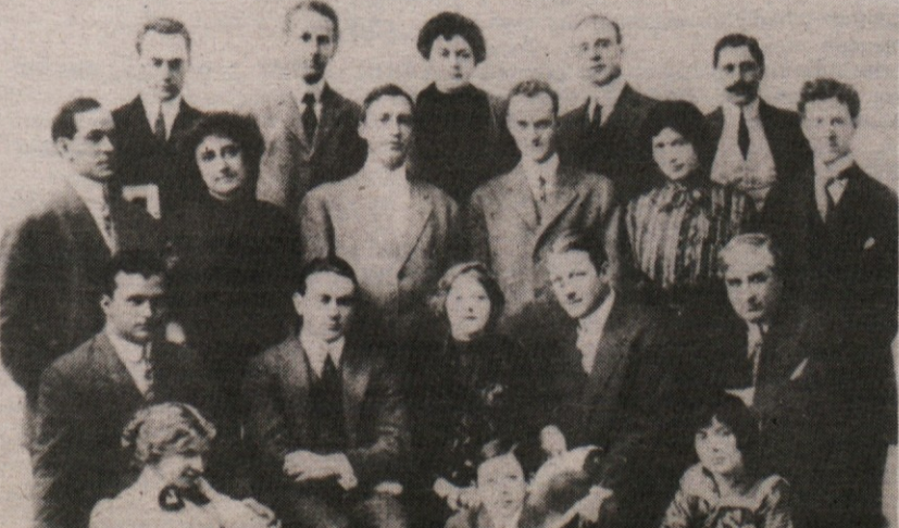
Pred kratkim je bila v Pordenonu retrospektiva »pionirja westerna« Thomasa H. Inceja, ki je na našem posnetku prvi na levi v drugi vrsti (od spodaj)

6.00, 6.30, 7.00, 8.00, 9.00, 10.00, 11.00, 12.00, 14.00, 19.00 Poročila; 6.20 Rekreacija; 6.45 Prometne informacije; 7.25 Dobro jutro, otroci; 7.35 Prometne informacije; 7.50 Iz naših sporedov; 8.05 Pionirski tednik; 9.05 Pojte z nami; 9.20 Matinejski koncert; 10.05 Po republikah in pokrajinah; 10.25 Dopoldne ob lahki glasbi; 11.30 Srečanja republik in pokrajin; 12.10 Naši poslušalci čestitajo in pozdravljajo; 12.30 Kmetijski nasveti; 13.00 Danes do 13. ure - Iz naših krajev - Iz naših sporedov; 14.05 Glasbena panorama; 15.00 Radio danes, radio jutri; 15.10 Zabavna glasba; 15.30 Dogodki in odmevi; 15.55 Zabavna glasba; 16.00 Vrtiljak; 17.00 Studio ob 17. uri - Zunanepolitični magazin; 18.00 Škatlica z godbo; 18.30 Mladi mladim - Jesenska serenada 84; 19.25 Zabavna glasba; 19.35 Za naše najmlajše; 19.45 Minute z ansamblom Mojmira Sepeta; 20.00 Oddaja za Slovence po svetu; Mladi mostovi; Naši kraji in ljudje; 23.05 Literarni nočno; 23.15 Od tod do polnoči; 00.05 - 5.00 Nočni program.