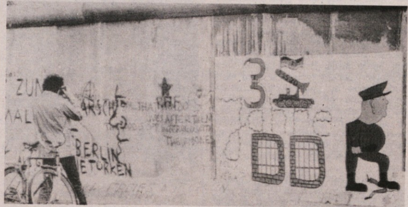
Ob 35-letnici ustanovitve NDR so neznanici poslikali berlinski zid v neposredni bližini prehoda, znanega pod imenom »Checkpoint Charlie«, s protisovjetskimi motivi