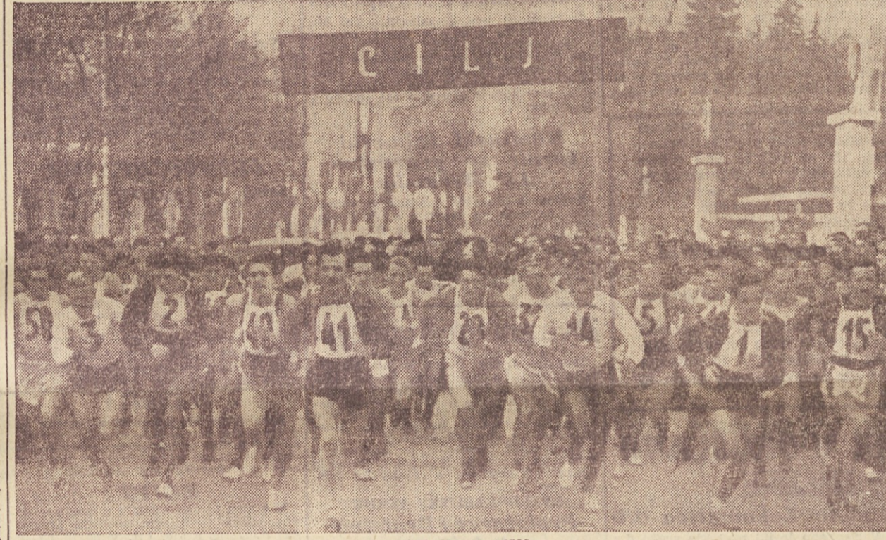
Start članov na 4500 m