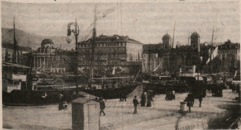
TRIESTE — Riva Carciotti dal molo S. Carlo. Caricatura di un momento importante del presente.

Molo San Carlo na prelomu prejšnjega stoletja. Delček slovenske literature oziroma naše prisotnosti v mestu. V ozadju grška pravoslavna cerkev, hotel de la Ville, zraven Palača Carciotti s kupolo. Danes pa prav gotovo ni videti toliko privezanih ladij