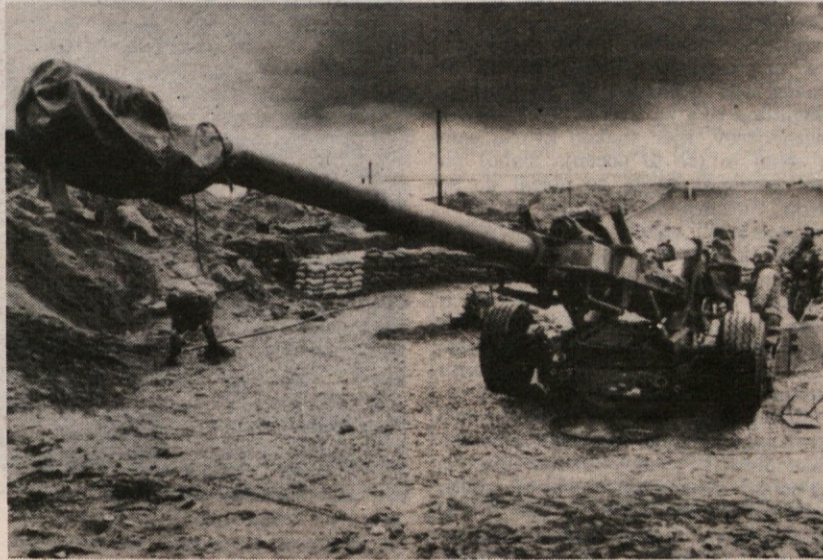
Včeraj so ameriški topovi molčali, a cevi so uperjene proti šufu

tako globalno reševanje bližnjevzhodnega vprašanja, čimprej bi hoteli doseči mir in začeti obnovo razdejane države. Po zadnjih vesteh se boji nadaljujejo kljub pozivom o prekinitvi ognja. Druzi in falanga se sploh ne menijo, da bi spoštovali sprejete obveznosti, pri tem pa jim krepko pomaga Džemajelova redna vojska, ki