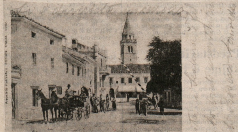
Dintorni di Trieste. Prosecco.

Molo San Carlo na prelomu prejšnjega stoletja. Delček slovenske literature oziroma naše prisotnosti v mestu. V ozadju grška pravoslavna cerkev, hotel de la Ville, zraven Palača Carciotti s kupolo. Danes pa prav gotovo ni videti toliko privezanih ladij