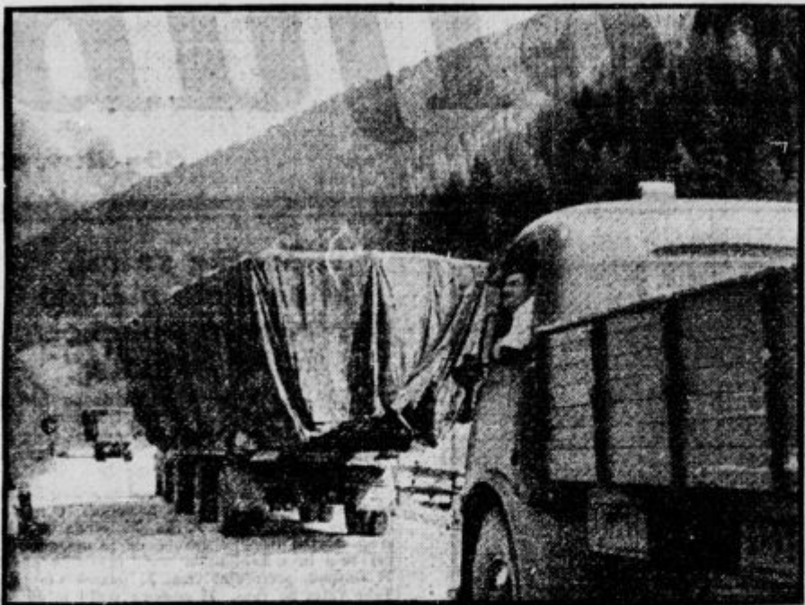
Male italijanske brze čolne MAS prevažajo po alpskih dolinah na poti proti Ladoškemu jezeru.