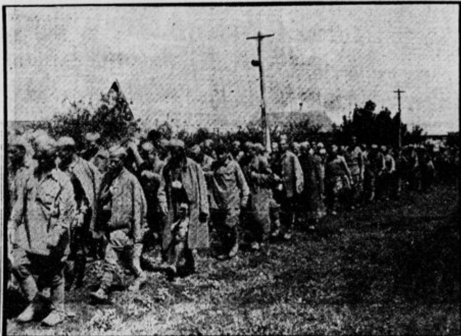
Množice sovjetskih ujetnikov, ki so jih italijanske čete zajele ob Donu.

s Spomenik padlim vojakom so odkrili dne 8. septembra v Belincih v Prekmurju. Sestavljen je v glavnem iz treh stebrov z napismi padlih vojakov iz beltsinske fare.