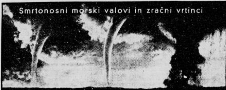
Smrtonosni morski valovi in zračni vrtinci