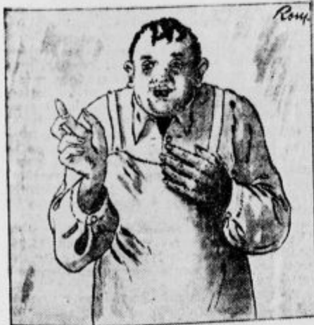
»Dovolite mi, visoki gospod...«

»Dovolite mi, visoki gospod,« je govoril, »če boste tega klateža izpustili, ga ne boste več našli, jaz pa se bom moral zadovoljiti s tem, da bom celal okraden brez upanja na kako povračilo. Če pa ga boste pridržali pod ključem, bom imel za