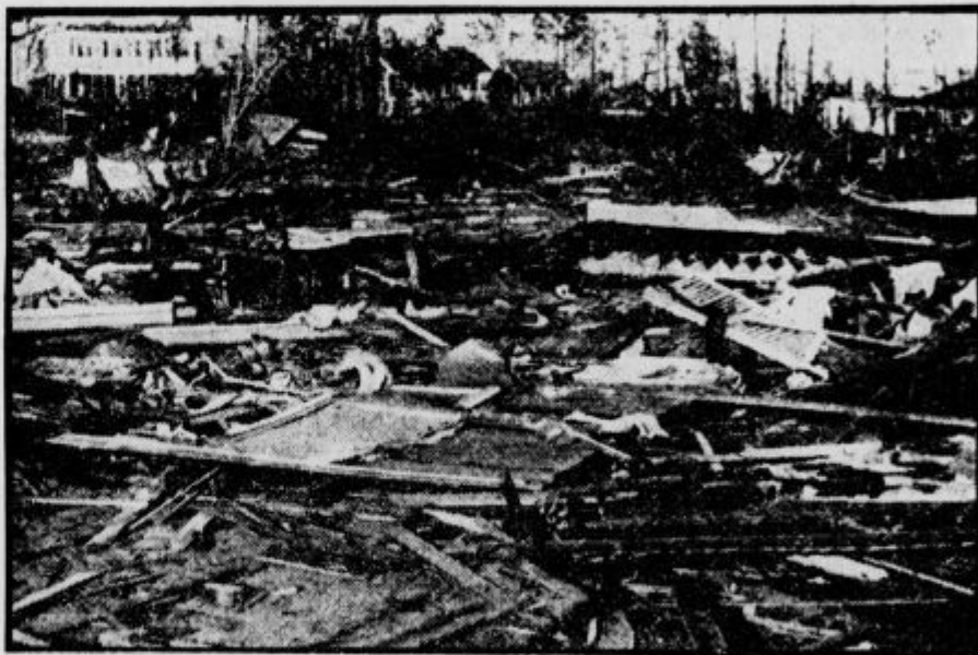
Sloveča kitajska luka Konkong

Dne 23. in 24. avgusta leta 1933 je vrtinec divjal nad Severno Ameriko. Strašno je bilo njegovo opustošenje. Mesto Norfolk v državi Virginija je bilo v razvalinah, naselje Salisbury v državi Maryland docela uničeno, v pokrajini