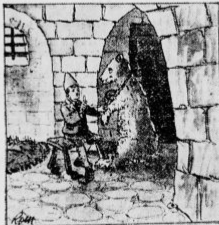
»To naj ti služi v pouk!«

»Bodi brez skrbi, mali, ne boš ostal zaprt dolgo časa. Zdi se mi, da je gospod medičar zahteval pretirano ceno za svoj med, kajti medved je imel le malo časa za izvršitev tatvine. Odpravil bom orožnike v trgovino, da bodo napravili potrebne poizvedbe, nakar se pojdejo pripraviti o resničnosti tvojih trditvev in bodo v ta namen izprašali tista dva cigana, tvoja prijatelja. Če se