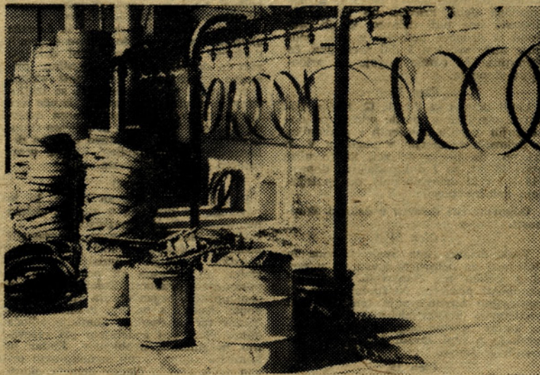
Ena poslednjih investicij v podjetju je bila ureditev lakirnice pri obratu IV.

Služba tehnične kontrole predvideva v svojem akcijskem programu uvedbo varčevanja na vseh področjih svoje dejavnosti, utrditev strokovne statistične analize kvalitete izdelkov, zmanjšanje slabe kvalitete izdelkov, vzgojitev delavcev pri načinu avtokontrole in drugo.