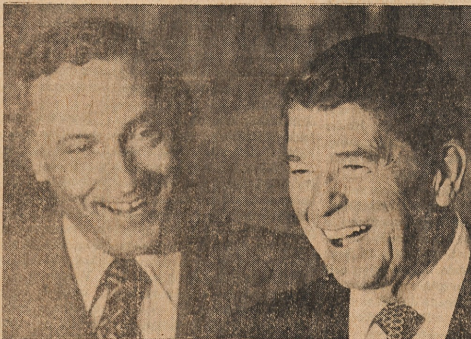
NISTA USPELA — Ronald Reagan (na desni) in sen. Richard Schweiker sta se močno prizadevala za dosego republikanske kandidature za predsednika in podpredsednika ZDA. Prišla sta blizu cilja, toda ga nista dosegla. Na sliki ju vidimo, ko sta imela še upanje na uspeh.