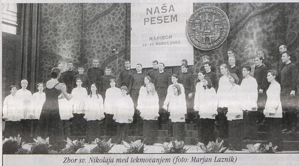
Zbor sv. Nikolaja med tekmovanjem (foto: Marjan Laznik)

S svečane podelitve posebnih priznanj zborovodkinji Heleni Fojkar Zupančič (foto: Marjan Laznik)