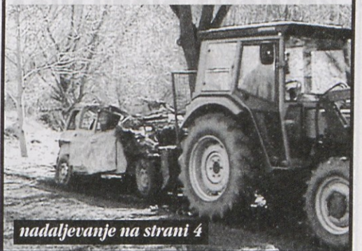
nadaljevanje na strani 4

Konec zime je čas, ko prej s snegom prekrite površine najbolj neusmiljeno odkrijejo - žal - človekov še vedno nespoštljiv odnos do bivalnega okolja in do narave. V Krajevni skupnosti Jevnica, kjer si močno prizadevajo premagati dediščino preteklih napak v delovanju krajevnih samouprav, so sklenili, da kot dober zgled za oživitve organiziranega delovanja krajevnih skupnosti izvedejo čistilno akcijo, s katero bi izboljšali videz ponekod že precej zanemarjenega in onesnaženega okolja. Obseženega dela so se lotili 5. aprila.