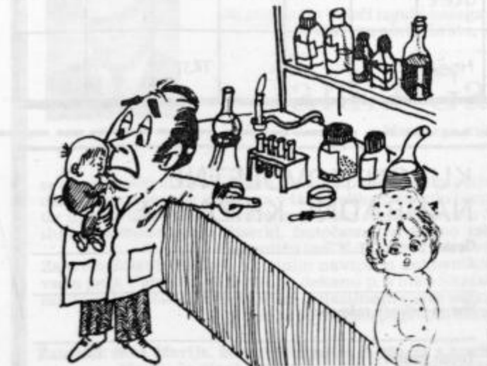
Zapomni si sinko, leta 2000 bodo mali otroci prihajali iz takihle stekleničk.