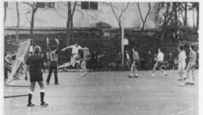
Zmaga od srečanj v Ormožu, kjer se gostom tokrat vedno slabo piše

Tudi uradne lestvice jesenskega dela prvenstva v vseh republiških rokometnih ligah so potrdile uspešno polsezono članov RK Ormož, ki nastopajo v drugi republiški ligi, skupina vzhod. Ormožani so namreč prvi s tremi točkami prednosti pred Fužinarjem in Radečami. To je lep uspeh, ki Ormožane uvršča med najresnejše kandidate za prvo mesto in s tem napredovanje v prvo republiško ligo.