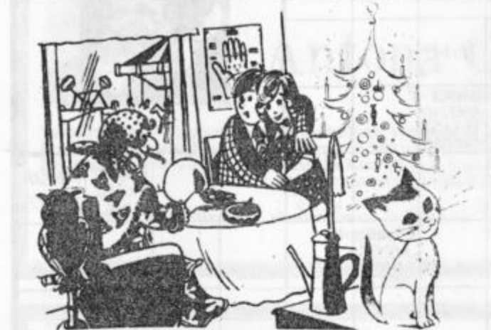
Ne teta jasnovidka, na ju ne zanima, če se bova poročila, vedela bi samo rada, če bova v letu 1984 dobila zaposlitev?