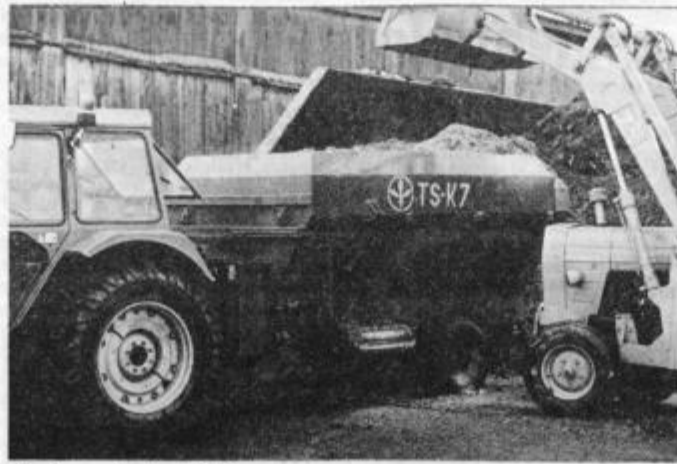
Krmilna prikolica TS-K7

mu v Gornji Radgoni zlato medaljo. Krmilna prikolica, doslej so jih izdelali pet, je namenjena lastnikom večjih govejih farm. Gre za prikolico, ki jo vleče oziroma poganja traktor. Vanjo dajo živinorejci v določenih odstotkih silažo, koncentrat in mletu koruzo, vse to pa se v prikolici temeljito premeša, nato pa s pomočjo transportnega traku dozira v jasli. Gre torej za zelo pomemben pripomoček pri krmljenju živine.