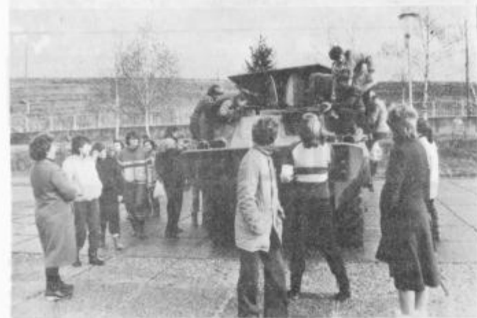
Mladi so si v velikem številu in zanimanjem ogledali predstavitev nekaterih orožij in dela vojaške tehnike