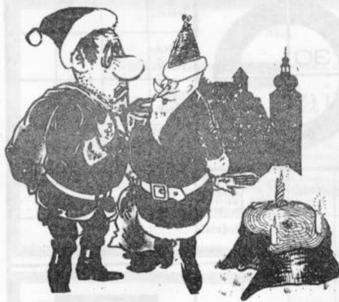
Vidiš, te svečke sem prižgal v spomin na vse tisto, kar smo v preteklosti mimo sekali...