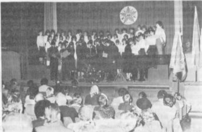
Mladi Ormožani so se predstavili z boemo Jama