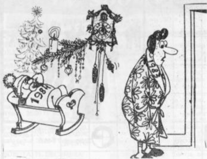
To ti je hvaležnost sveta. Do zadnjega trenutka te vlečejo, potem ti pa za vedno vrata pokažejo!