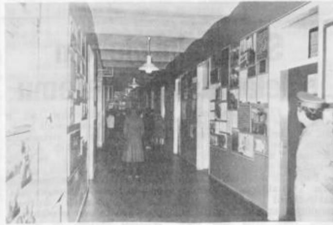
Vojaki in starešine so gostom s ponosom pokazali priložnostno razstavo

gostiteljev ogledali razstavo o razvoju JLA.