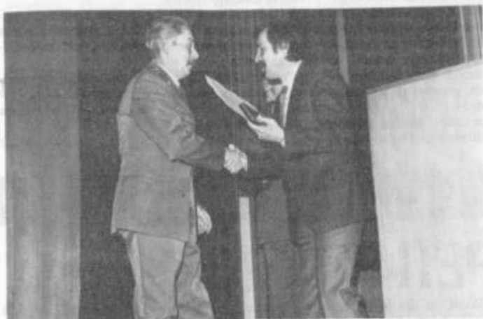
S podelitve priznanj, odlikovanj in pohval