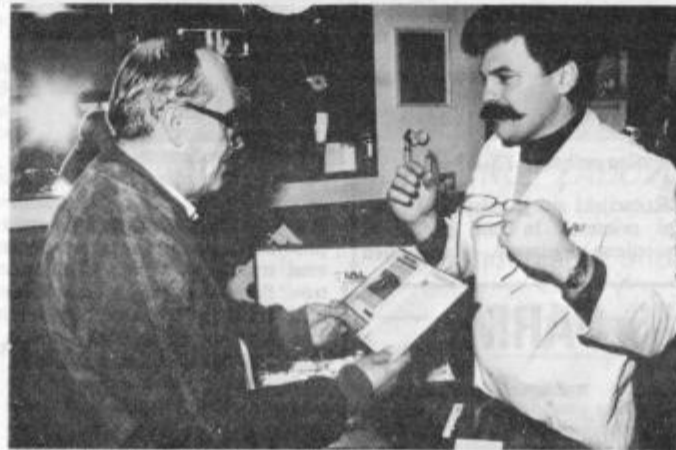
Za tisočo stranko očala zastoj

magam. Hvaležen sem vsem, ki so me kdajkoli obiskali in vsem, ki me še bodo. Vsem bi rad poklonil novoletno darilo, pa žal to ni mogoče. Zato sem se odločil in svoji letošnji tisoči stranki očala podaril. Upam, da bo prihodnje leto strank še več, saj jim bom poleg