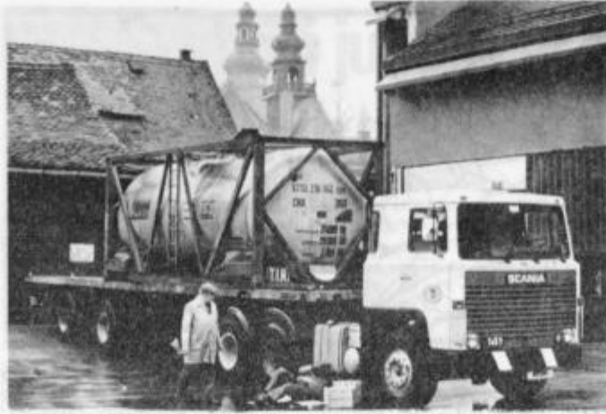
Druga 20-tisoč-litrška cisterna Laškega rizlinga za Japonskega kupca

republika Nemčija, Belgija in Velika Britanija. V zadnjem času so uspeli prodreti z našo žlahtno kapljico prav na drugi konec sveta — na Japonsko. Prejšnji teden so odpremili že drugo 20 tisoč litrsko cisterno Laškega rizlinga. Razveseljivo je, da se tudi za prihodnje leto že dogovarjajo za izvoz večjih količin vina v to daljno deželo, pa tudi dejstvo, da Japonci plačajo več kot zahodnoevropski in ameriški kupci. Odpiranje novih tržišč daje ptujskim kletarjem možnosti bistvenega povečanja izvoza. Tako