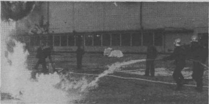
Člani gasilskega društva Papirnice Vevče so v tednu požarne varnosti organizirali vajo: gašenje lahko vnetljivih tekočin. Gasili so s težko in s srednje lahko peno. Prikaz gašenja jim je dobro uspel.