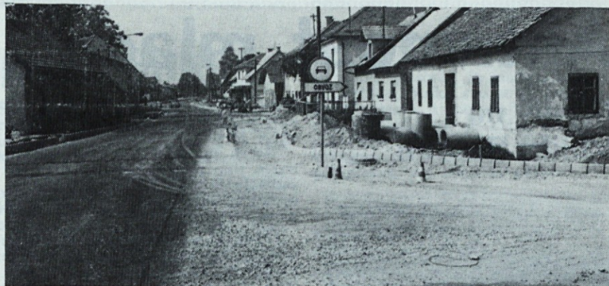
Gradnja pločnikov in rekonstrukcija ceste skozi Vir.