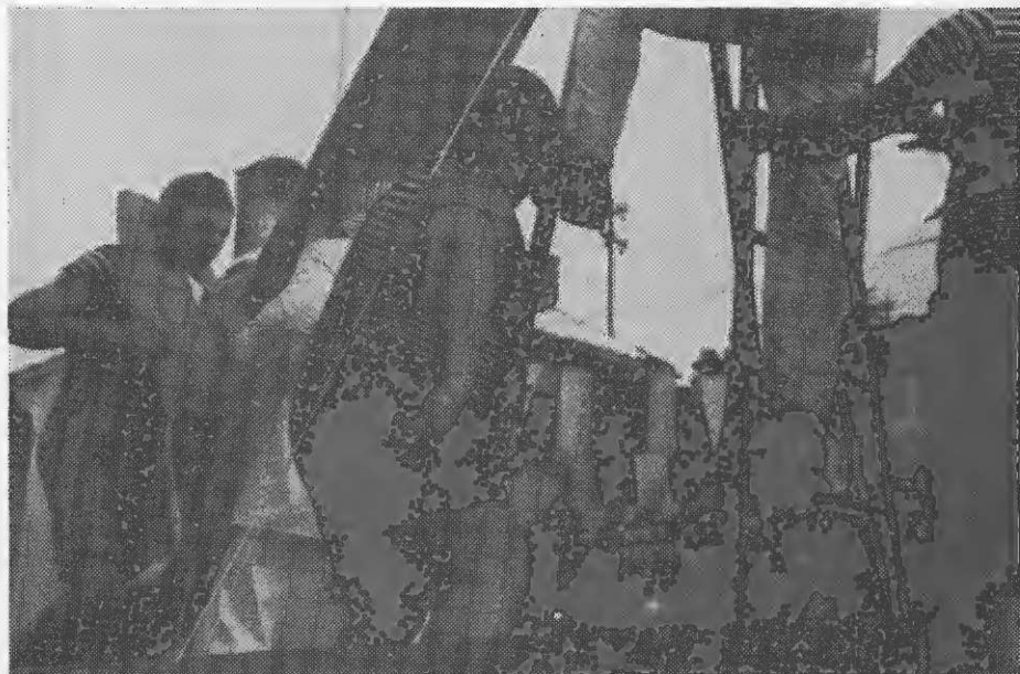
V Mozirju so imeli nekoč čudovito naravno kopališče "Kopelce" imenovano, pa so ga povsem zapustili. Pust Mozirski je zato s prizorom opozoril na potrebo po takšnem kopališču.