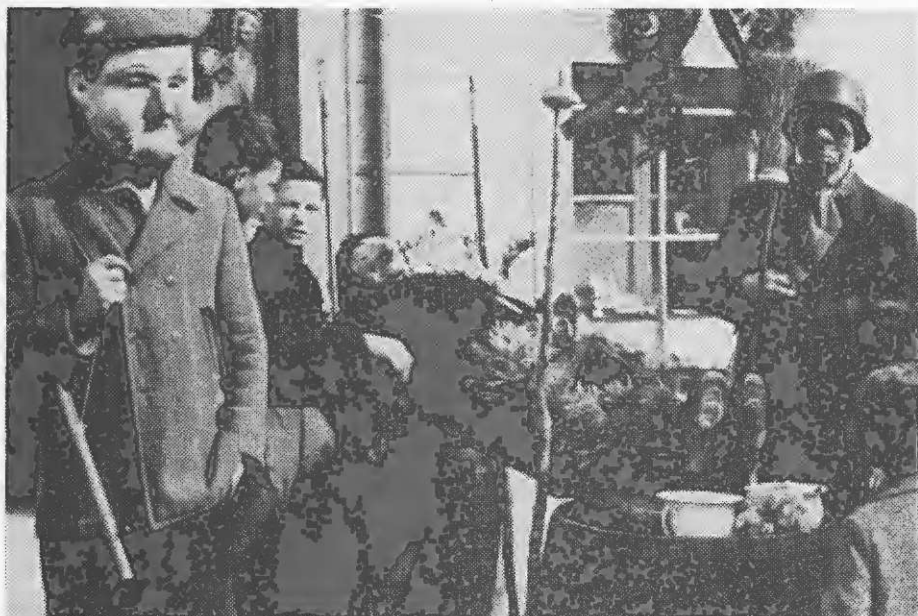
Truplo Pusta Mozirskega na mrtvaškem odru. Stražijo ga vrli pustnaki, tokrat drugače oblečeni.