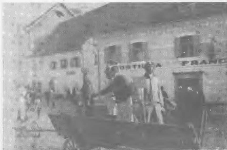
Prizor pustovanja iz leta 1932