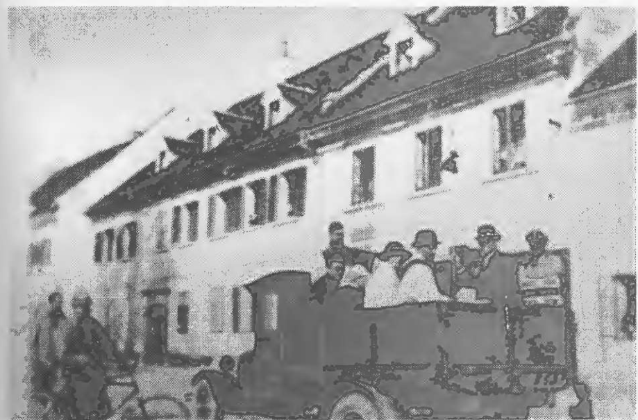
Predstavniki mozirskega pustnega zastopstva na Miklavčevem tovornjaku leta 1932