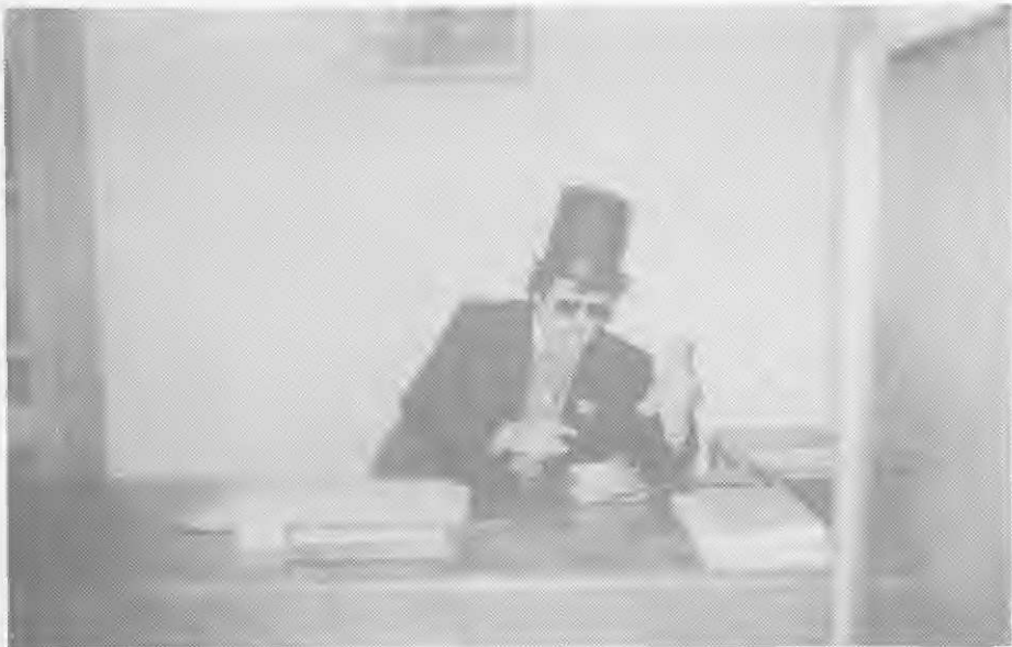
Pustni župan na predsedniškem stolu na občini