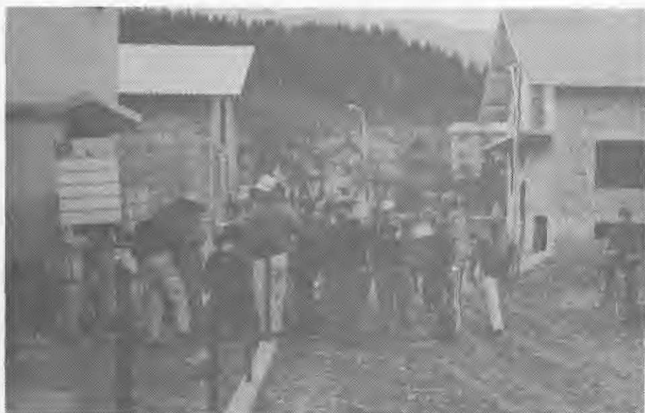
Ofiranje na Tratah, ki so jih tedaj šele pozidavali