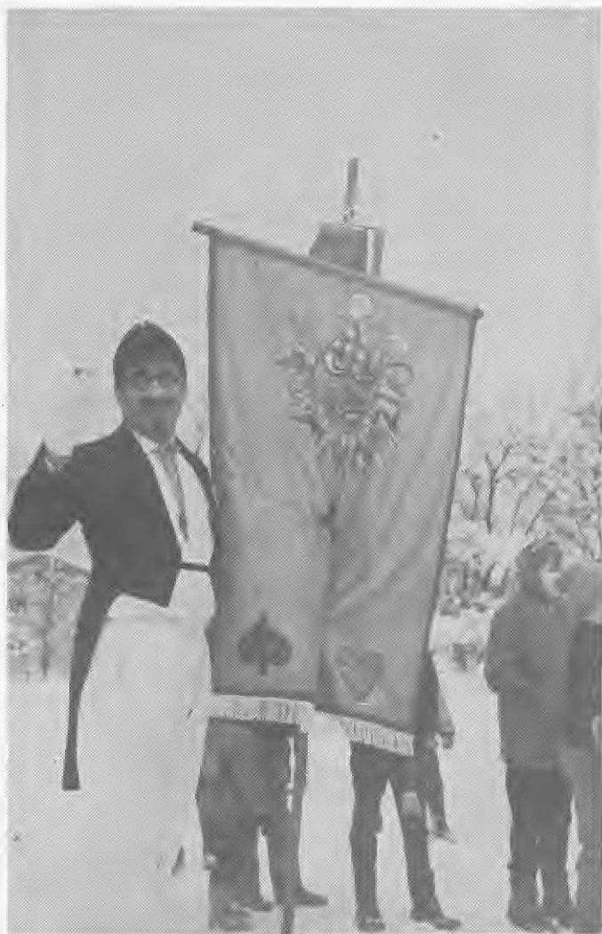
Fana (bandero) Pusta Mozirskega