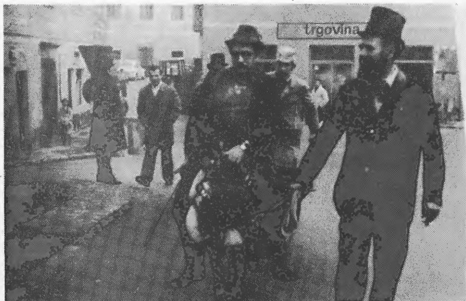
Pustni župan jaha na občino, kjer bo prevzel oblast.

Seveda je takih spominov za celo knjigo! Pa vendar, nekaj jih ostane vedno bolj v spominu.