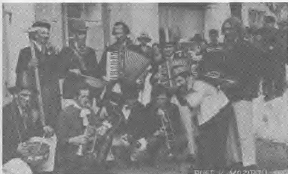
Svetovno znani pustni orkester Boj se ga je že leta 1952 predstavljajl pravo glasbeno pridobitev v Mozirju