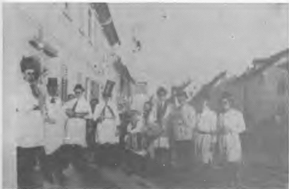
Pustni orkester leta 1932 pred Maksetovo hišo