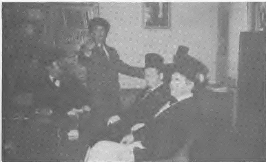
Župan mozirske občine se ni kaj dosti upiral prevzemu oblasti po postnem županu, tudi pustni svetniki so se v sobi predsednika občine kar dobro počutili