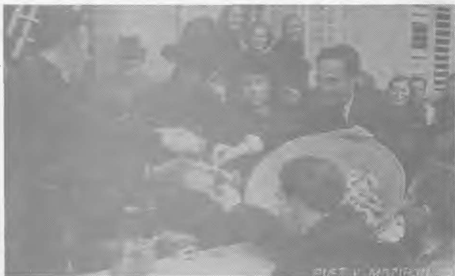
Med sedmino, na sliki ne preveč žalostna Pustneta, sicer žalujoča vdova po preminulem Pustu