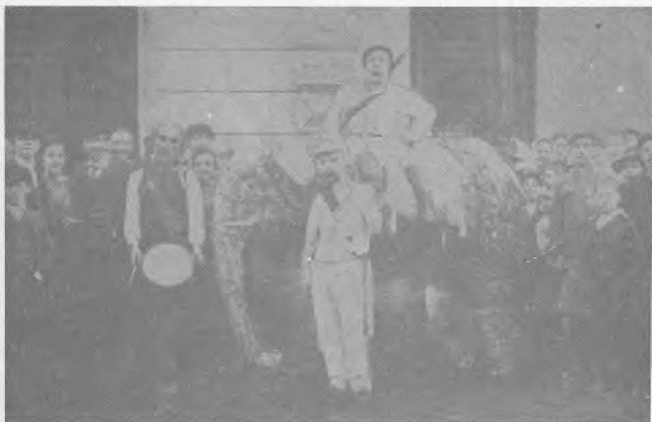
Ena najstarejših ohranjenih slik o pustovanju v Mozirju. Gre za prizor, ko so po trgu vodili Slona, na njem pa je ponosno sedel veliki afriški lovec (tako je namreč o sebi trdil neki Mozirjan...).

V času pred prvo svetovno vojno je najbolj znan sprevod s slonom. Tu je šlo za smešenje nekega tržana, ki se je potikal po svetu in trdil tudi, kako da je v Afriki pokončal samega slona... Huda zdraha med gospodinjami je nastala zaradi kur, ki so pač iskale piče tam kjer je ta bila, zato so brskale po vrtovih imenitnikov, seveda se uboge kure tega niso zavedale, in nič hujšega... Spor je moral poravnati sam župan in seveda ga je uprizoril Pust v veliko veselje tistih, ki kur niso imeli. Velikokrat so oponašali razne znane krajane in njih dejanja. Pred prvo svetovno vojno in tudi po njej, so imeli vedno likof pred Šustarjevo kletjo. Pek Šustar je za nje spekel posebne preste, ki so jih skupaj s tokovcem (jabolčnikom) v veselem razpoloženju zavžili. Običajno je bilo, da se je likofa udeležil tudi trški župan.