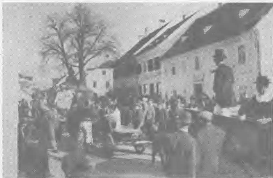
Po trgu so rogovilili pustnaki tudi leta 1932