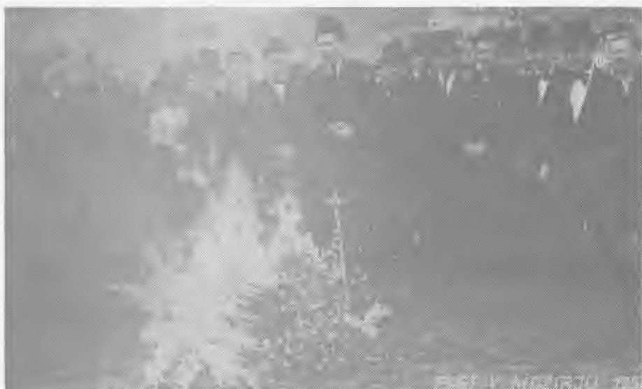
Zadnje dejanje ob žalostni smrti Pusta Mozirskega na Pekovih lavah