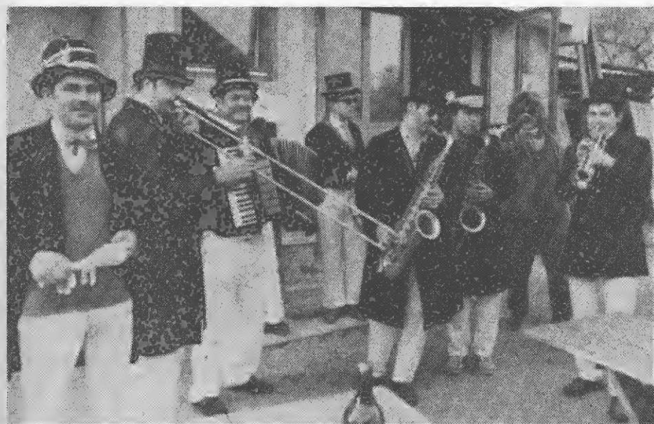
Občeznani orkester "Boj se ga" v vsej svoji prizadevnosti za dobro vzdušje ob pustnih prireditvah