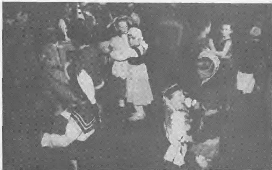
Vsakoletna otroška maškerada pomeni otrokom veliko veselje

Seveda je treba vedeti, da tedaj, leta 1952 še ni bilo pralnih strojev in običaj je bil, da so manjši kraji imeli svoje perišče ob kakem bistrem potoku. Pustniki so pripravili pranje perila kar v Šajšpahu, kar je spodbudilo krajevne veličine, da so nemudoma uredili perišče ob strugi na sejmišču. V spominu številnih prebivalcev je tudi pustno reševanje stanovanjskega vprašanja vidnih funkcionarjev. Zgodilo se je, da je nameraval v Mozirju priti neki birokrat (uradnik), baje je bil prava zvezda svoje sredine! Seveda je pred tem želel vedeti kje bo stanoval. Krajevni ugledneži so kar njemu prepustili izbiro stanovanja in ta "strokovnjak" je izbral