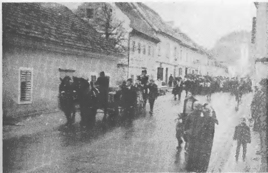
Pogrebne slovesnosti za Pustom so vedno zelo svečane

Že od nekdanj so bile glavne prireditve na pustni torek in to Na trgu. Tedaj seveda ni bilo toliko avtobusov in lahko je uspelo najti primeren čas za nastop. Sedaj je po eni strani lažje, ploščad pred Turistom je zelo primerna za oder, po drugi pa težje, ker je tolikšen promet in s tem velika gneča na pretesnem prostoru. Pustne prireditve so ljudje radi in z zanimanjem pričakovali, češ, koga bodo pustnaki letos "obdelali".