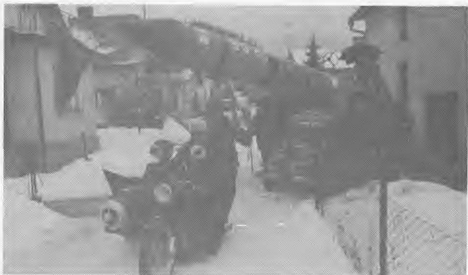
Rakete so postale zanimive tudi v Mozirju, zato jih je ljudem prikazala pustna srenja