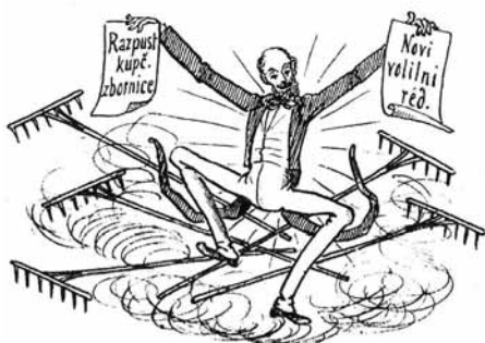
9. „Le čakajte, Slovenci, jaz Bom dal vam eno čez obraz!“