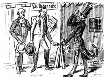
7. V vasi Dobrničah bilo Nekaj čudnega se zgodilo.