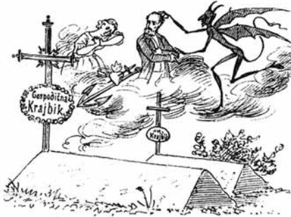
3. Ej, Frèncelj, Frèncelj, si Ti to Oboje spravalil pod zemljo?