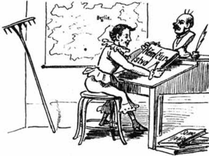
1. Ko mlad Frèncelj se učil, Bismark za izgled mu bil.