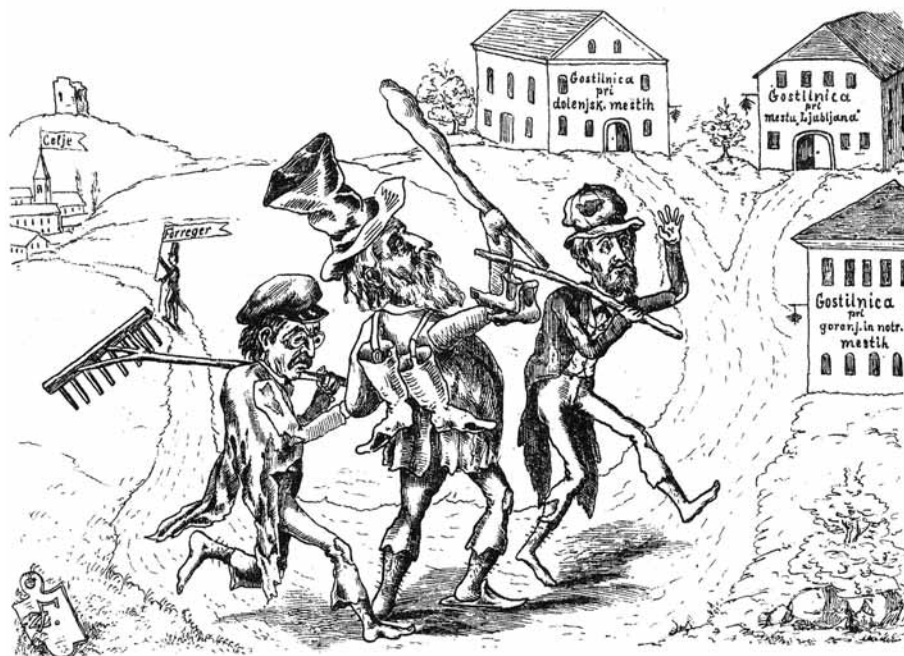
Slika 3: Franc Zorec, »Trije kandidati: Dežman, Kromer in Vestenek«, Brenclj , 1879, št. 12.

Fig. 3: Franc Zorec, "Three candidates: Dežman, Koromer, and Vesteneck", Brenclj , 1879, no. 12.