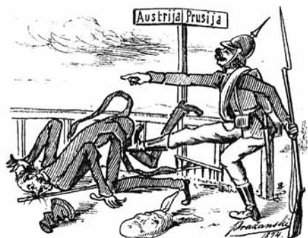
11. Na meji prusk bo policaj Obrnil vljudno ga nazaj.