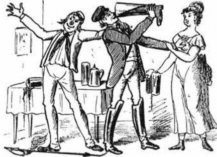
2. Potem študiral je tako-le V mestu Gradcu više šole.