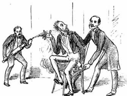
8. Grof Barbo mu zato podžgé, A tast pri roki z hrizgijo je.