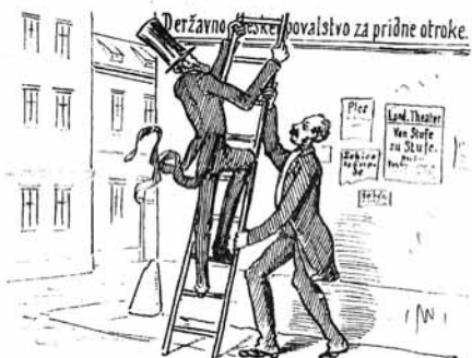
6. Dobro je, če tasta se dobi, Ki lestvo plazajočemu drži.