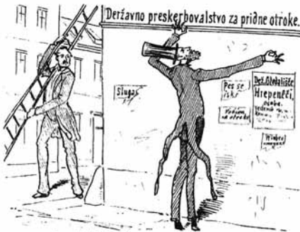
5. Pridni tu so preskrbljeni, Da bi kdo prinesel lestvo meni.