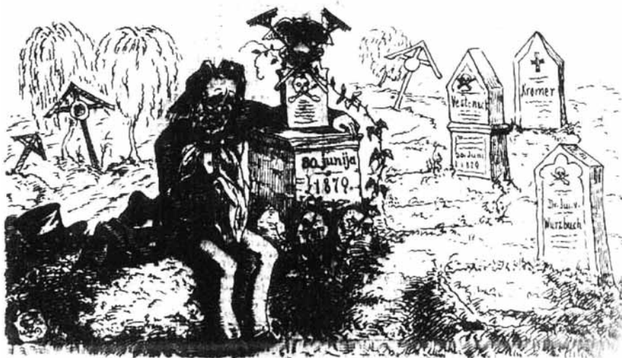
Slika 4: Franc Zorec, »Vernih duš dan na kranjskem političnem pokopališči«, Brenclj , 1879, št. 8.