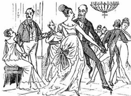
4. Pa nič ne dé! Prvi korak V politiko ni pretežak.