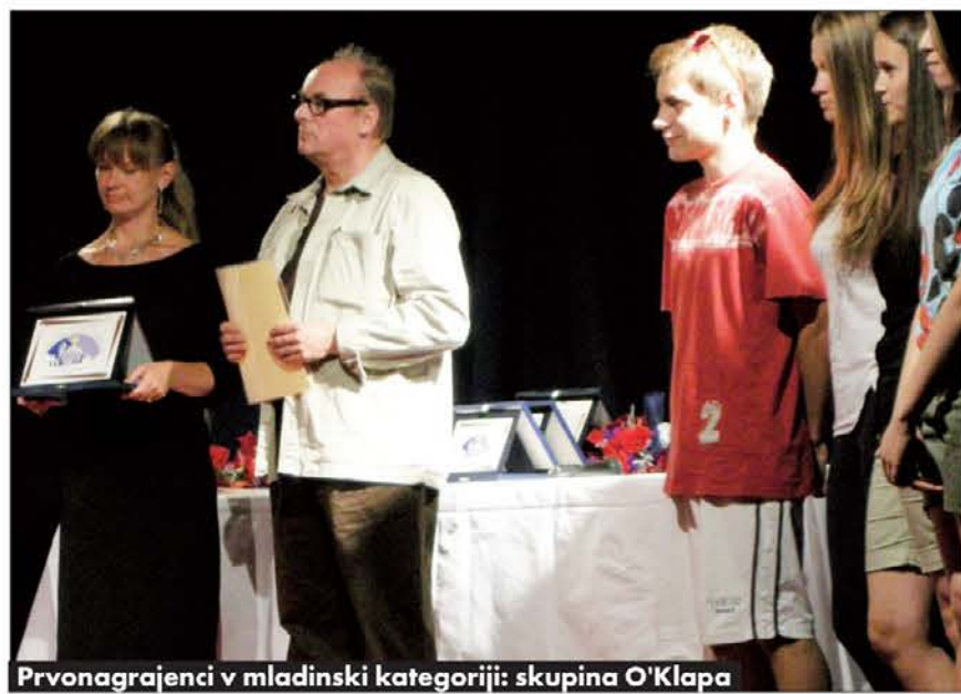
Prvonagrajenci v mladinski kategoriji: skupina O'Klapa

pnosti, ki tudi s tem festivalom dokazuje svojo živost in trmasto vztrajnost obstati na svoji zemlji!