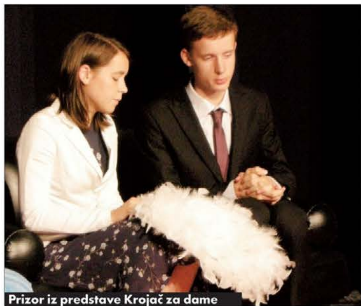
Prizor iz predstave Krojač za dame