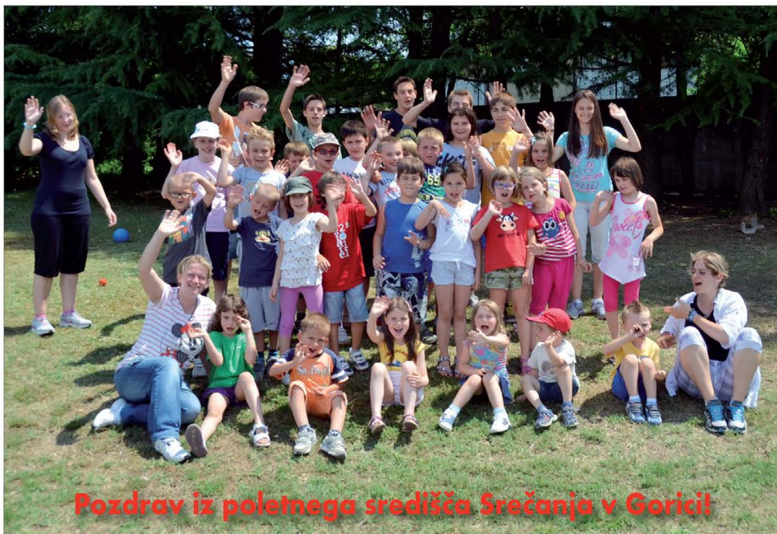
Pozdrav iz poletnega središča Srečanja v Gorici!