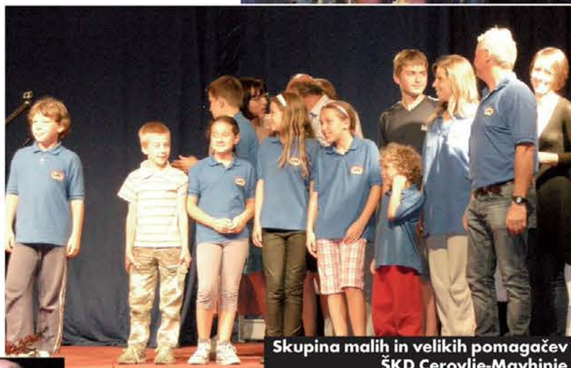
Skupina malih in velikih pomagačev ŠKD Cerovlje-Mavhinje