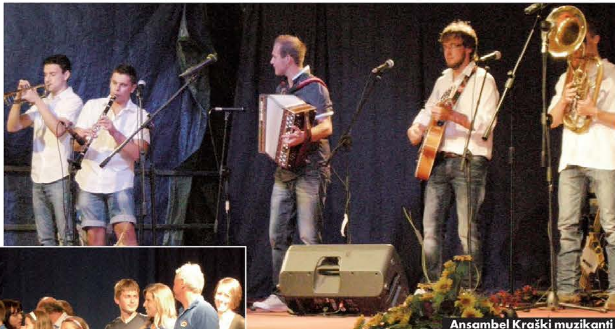
Ansambel Kraški muzikanti