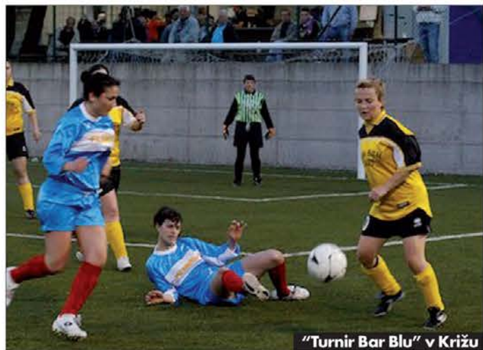
"Turnir Bar Blu" v Križu

Najprej o širšem okviru teh športno-rekreativnih tekmovalj. Gre v bistvu za turnirje, ki jih posamezna društva in ustanove organizirajo v dobi trajanja vaškega praznika oziroma poletne šagre. Številni so tako na Tržaškem kot na Goriškem in zaposlujejo res veliko nogometašev, ki si tako vsaj še ves junij ne privoščijo pravega odklopa od večerne športne dejavnosti. Veliko je na teh manifestacijah sicer tudi športnikov, ki se praviloma ukvarjajo z drugimi panogami. Ne boste verjeli, nekateri so res odlični,