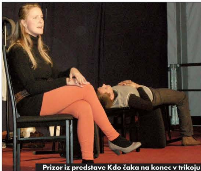
Prizor iz predstave Kdo čaka na konec v trikoju