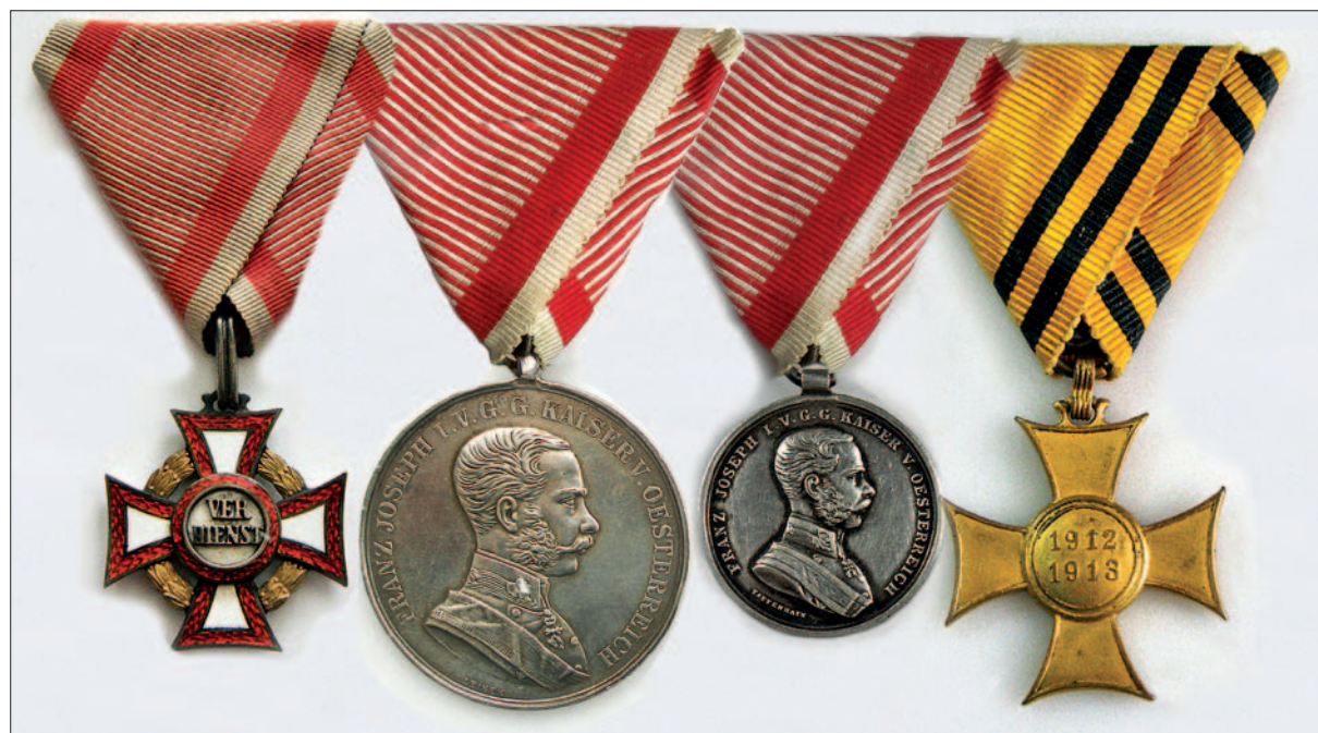
Portret Mihaela Gabrijelčiča in odlikovanja, kakršna je prejel.

Oberleutnant im k. u. k. Infanterie-Regiment Nr. 24 Besitzer des Eisernen Kronen-Ordens III. Klasse mit der Kriegsdekoration, des Militär-Verdienstkreuzes III. Klasse mit der Kriegsdekoration, der Silbernen Tapferkeitsmedaille I. und II. Klasse gefallen am 25. Mai 1916 bei einem Sturmangriffe am Berge Civaron in Südtirol.