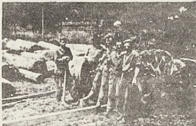
Najdebelejši hloed iz gozda GG KARLOVAC CO Krašič - sečišče BIAŽEVO BRDO 4,80 m 3 - leta 1966

Že v letnem planu je točno določeno, koliko hlodevine bomo pradelali v tistem letu, sgradi se tudi, da se po poteku pol leta napravi rebalans plana. Točno je tudi odrejena mesečna dobava po vrstah hlodev. (Nadaljevanje na lo. strani)