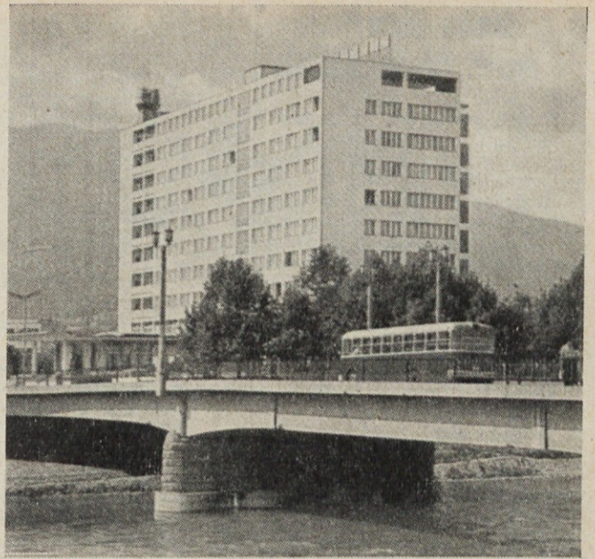
Grand hotel »Skopje«

V sredo zjutraj sem odnesel svoj prtjlago na kolodvor in se podal tekem dopoldneva na ogled mesta. Prepešačil sem strogi center mesta in iskal njegovo središče. Ogledal sem si ostanke-spomenik železniške postaje Skopja. Škoda, da ga zanamarjajo in ga je že zob časa močno načel. V mestu je na mnogih hišah videti sledove potresa. Kolikor pa je novih so to osem, deset ali dvajset nadstropne hiše, pretežno bloki. Večkrat sem se ustavil in gledal strešne žlebove in poskusil ugotoviti kaj niso zavrvali — hišo ali žleb. Ogledal sem si Karpoš—ena in dve, ter vprašal mnoge Skopjance,