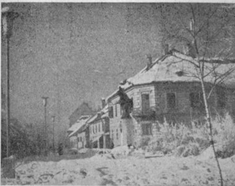
Zalec je letos pričakal delegate v belem ogrinjalu.